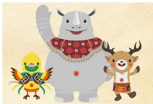
Gambar 3: Bhin-Bhin, Kaka, Atung (Maskot Asian Games 2018 )

https://www.biem.co/read/2018/06/03/20284/