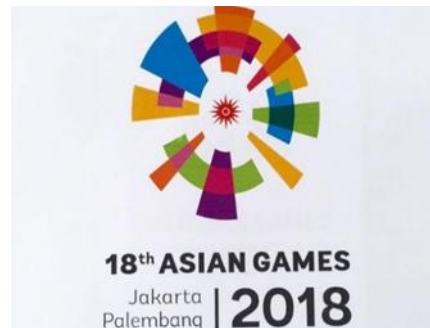
Gambar 2: Logo Resmi Asian Games ke-18

bendera negara-negara di Asia yang juga menggambarkan berbagai ragam kebudayaan dan Bahasa (Raimeidi, 2018).