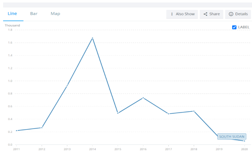
Gambar 1. Jumlah Korban Jiwa Akibat Perang di Sudan Selatan Tahun 2011-2021

Pada tahun 2013, konflik sipil yang terjadi antara presiden dan wakilnya memperburuk keadaan dan legitimasi pemerintahan. Pada dasarnya, fondasi pemerintahan Sudan Selatan mungkin memang sudah rapuh sejak awal, mengingat adanya perbedaan yang cukup signifikan antara Kiir dengan Machar. Namun, kenyataannya tidak ada usaha dari pemerintah untuk memberikan keamanan bagi masyarakat. Kekerasan antarkomunitas masih terus meningkat, mengakibatkan ratusan ribu orang terbunuh (World Bank 2022). Para pemimpin politik dan militer juga tidak dapat menghentikan perang, namun justru mereka menambah kekerasan dengan memasok senjata ke masyarakat.