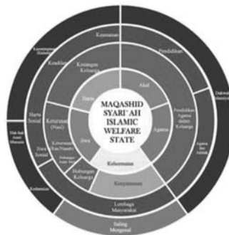
Diagram 1 Maqashid Syariah Menurut Jamaluddin Athiyah