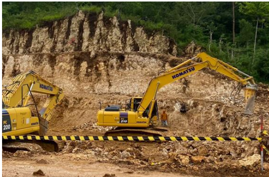
Gambar 3. Pekerjaan Cut and Fill

Gambar di atas menunjukkan pekerjaan cut and fill pada Proyek Pembangunan Jalan Tepus - Jerukwadel II. Berdasarkan pengamatan, para pekerja dalam proyek ini belum sepenuhnya mematuhi standar keselamatan yang berlaku, sehingga berisiko mengalami kecelakaan kerja yang serius, yaitu longsornya tumpukan bebatuan yang menyebabkan mengenai kepala pekerja di bawah yang sedang bekerja. Hal ini dapat dikategorikan sebagai kecelakaan fatal karena jika seorang pekerja terkena kejatuhan batu bongkaran excavator breaker dan excavator bucket , maka berpotensi mengalami cedera parah atau bahkan kematian. Kematian akibat kejatuhan batu bongkaran dari ketinggian dapat terjadi jika pekerja terbentur pada bagian kepala, tertimpa alat berat di bawahnya, atau terkena material yang ikut jatuh bersamaan.