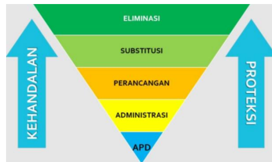
Gambar 1. Hierarki pengendalian risiko Sumber: OHSAS 18001 (2007)