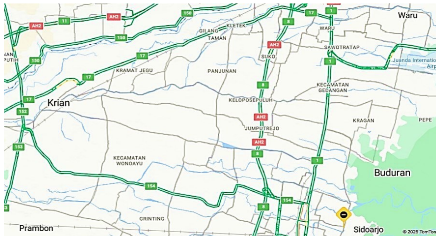
Gambar 4.1 Batas Wilayah Kecamatan Wonoayu

Lokasi tempat penelitian yang dilakukan peneliti yakni tepat di dusun duran kecamatan wonoayu kabupaten sidoarjo. Berikut gambar dusun duran Desa Karangpuri kecamatan wonoayu.