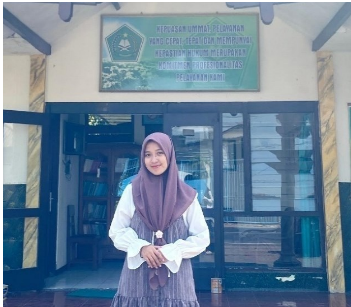
(Gambar 1 tempat mengambil data yaitu Kantor Urusan Agama Kecamatan Wonoayu)