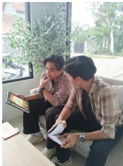
Gambar 4.4 Wawancara dengan Informan Dimas (Samaran)

“saya ngga mau mas semisal anak saya ikutan main kek gini juga, kalau semisal punya anak ntar saya bakal ajarin yang baik baik aja mas” 52