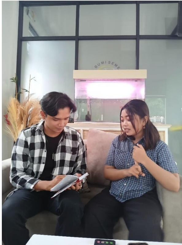
Gambar 4.2 Wawancara dengan Informan Risiko (Samaran)