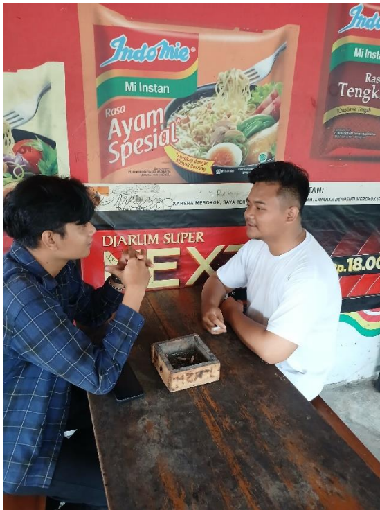
Gambar 4.3 Wawancara dengan Informan Deni (Samaran)