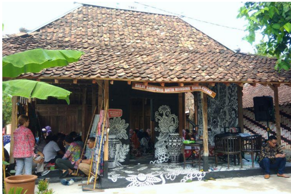
Gambar 3.1 Dokumentasi Balai Kampung Batik Manding Siberkreasi

Adapun tempat yang mereka bangun untuk menjadi titik kumpul bagi masyarakat setempat berupa balai yang dihiasi dengan lukisan-lukisan batik hasil karya masyarakat setempat.