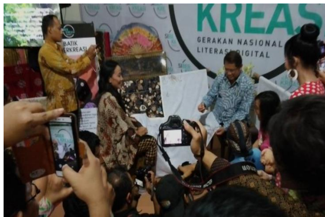
Gambar 3.3 Dokumentasi Pencantingan Pertama Oleh Menkominfo RI Rudiantara di Yogyakarta 2018

“Kalau biasanya setiap ada kegiatan sih kita diikutsertakan, kan siberkreasi itu jejaring pengembangan untuk cakap digital seluruh Indonesia atau literasi digital. Jadi kita juga kemarin dapat pelatihan untuk latihan menggunakan internet, website, seperti pengenalan e-commerce yang sederhana.”(Wawancara Guntur, 10 Oktober 2021)