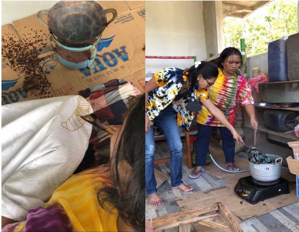
Gambar 3.5 Dokumentasi Pelatihan Membatik