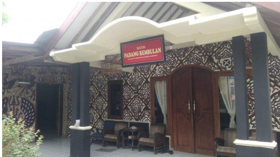
Gambar 3.4 Dokumentasi Salah Satu Kios Batik Di Kampung Batik Manding Siberkreasi

Selain dari inovasi yang dilakukan terhadap motif batik, telah berdiri beberaps kios batik yang mampu menjadi tempat untuk mendukung perekonomian mereka sekaligus meningkatkan pariwisata daerah setempat walaupun semua masih dalam jumlah yang relatif kecil.