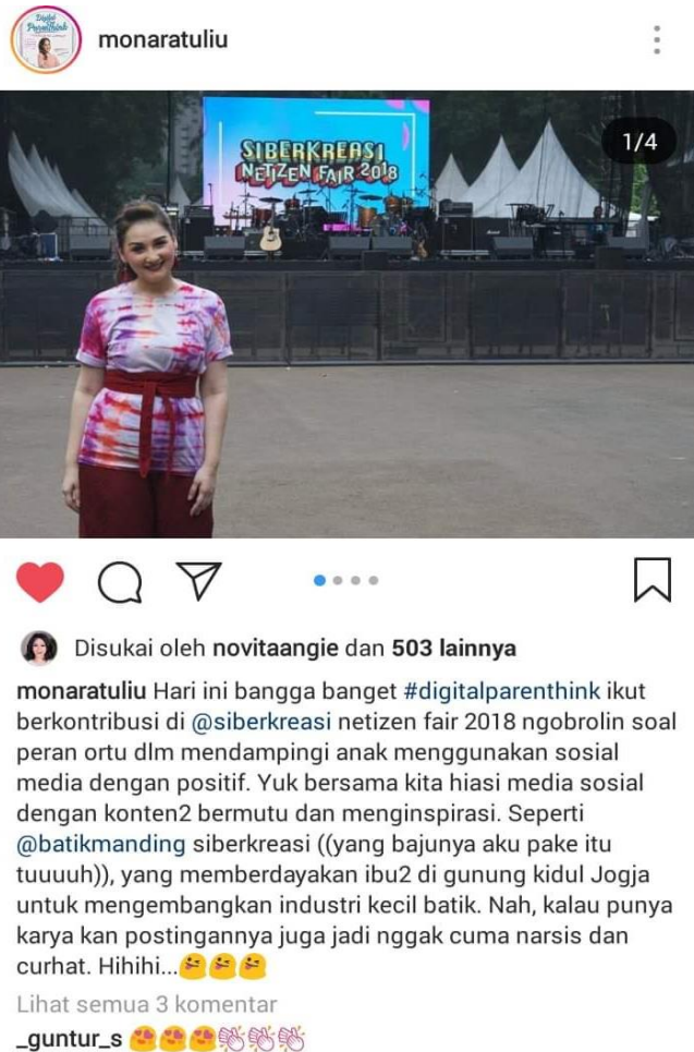
Gambar 3.6 Dokumentasi Salah Satu Bentuk Keberpengaruhannya Hadirnya Kampung Batik Manding Siberkreasi