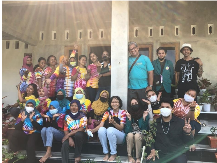
Gambar 3.2 Dokumentasi Setelah Selesai Sosialisasi Kepada Masyarakat

Adapun hal lain yang dapat membantu penginisiasi untuk mengajak masyarakat ikut bergabung dalam program yang sedang dijalankan, hal ini dikarenakan adanya predikat desa budaya yang salah satu syarat utamanya untuk bisa diberikan apresiasi sebagai desa budaya yaitu memiliki program membatik.