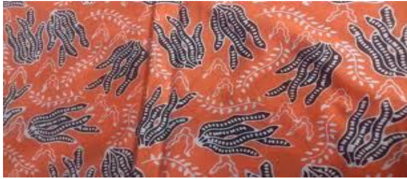
Gambar 2.1

Guntur Susilo selaku ketua sekaligus penanggung jawab dari kampung tersebut dalam wawancara (Wawancara Guntur, 10 Oktober 2021) menyampaikan hadirnya Kampung Batik Manding Siberkreasi juga sebagai salah satu upaya untuk mewujudkan kampung yang dapat mandiri, sejahtera, lestari, dan berbudaya. Kampung Batik Manding Siberkreasi yang telah berjalan dari tahun 2018 dengan proses pendampingan dari sepasang suami istri yaitu Bapak Guntur Susilo dan Ibu Dwi Lestari memiliki beberapa prestasi diantaranya, pada tanggal 2 Oktober 2018 Kampung Batik Manding Siberkreasi diresmikan oleh Kemenkominfo RI, mengadakan Live Mural yang mengangkat tema “Batik Menjadi Bekal Kearifan Lokal di Era Digital” pada tahun 2018, mendapatkan kesempatan untuk performance art di Jln. Malioboro dengan teman “Batik To The Moon, Alien On The Road”, wisatawan asing yang terbilang sering berkunjung untuk belajar membatik, mendapat kunjungan dari JIBB sebagai tujuan dari heritage tour yang diadakan pada saat memperingati hari batik nasional, mendapat kunjungan dari World Craft Council, dan beberapa ulasan mengenai Kampung Batik Manding Siberkreasi di media massa Indonesia tentang aktivitas positif yang diselenggarakan di kampung tersebut.