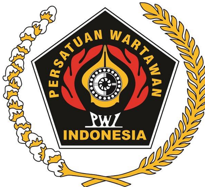
Gambar 2 Logo PWI

sumber : https://www.pwi.or.id/tentangpwi (diambil pada 10 Februari 2023)