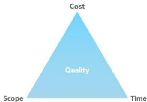
Gambar 3. 1 Project Management Triangle

Pernyataan-pernyataan yang ada menyimpulkan bahwa kegiatan konstruksi memiliki tiga komponen utama yang mempengaruhi hasil pekerjaan, yakni mutu, waktu, dan biaya. Hal ini dikenal sebagai triple constraint atau project management triangle yang ditunjukkan pada Gambar 3. 1.