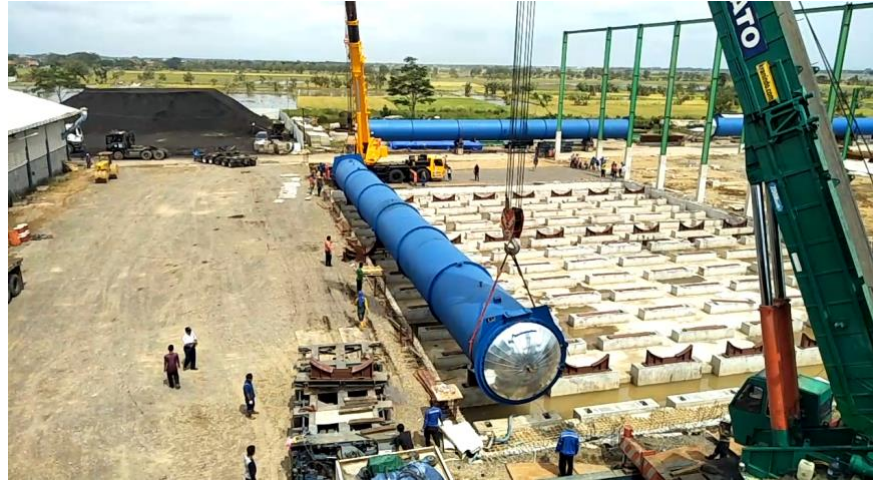
Gambar 5. 2 Proses Instalasi Autoclave ke Saddle Support

loading autoclave akan kembali dilakukan untuk memindahkan autoclave dari storage area ke titik pemasangan di atas saddle support.