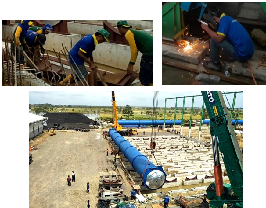
Gambar 5. 3 Kondisi saat Instalasi Autoclave

risiko lanjut yang baik. Namun, keberhasilan pengendalian risiko yang ada tergantung pada pengawasan pelaksanaan pengendalian risiko tersebut. Berdasarkan hasil pengamatan dan wawancara yang telah dilakukan, tim proyek sudah baik dalam pengawasan pengendalian risiko khususnya pada penggunaan alat berat (baik pemilihan alat dan pemeliharaan perlengkapan). Namun, pengawasan pada saat pelaksanaan masih kurang baik. Hal ini dapat dilihat pada Gambar 5. 3 Kondisi saat Instalasi Autoclave.