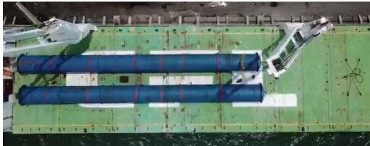
Gambar 5. 1 Autoclave Tiba di Pelabuhan Tanjung Emas

Tahap pekerjaan ini adalah transportasi material autoclave ke site . Material autoclave dikirim dari Cina ke Pelabuhan Tanjung Emas, Semarang. Autoclave memiliki panjang 40 meter, diameter 3 meter, dan berat 80 ton. Tentunya, pengiriman akan memerlukan truk pengirim dengan jumlah 8 gandar, sehingga tidak merusak jalan. Tim proyek melakukan pengawalan dari Pelabuhan Tanjung Emas menuju lokasi proyek di Demak. Risiko yang mungkin muncul adalah gangguan lalu lintas saat pengiriman material ke site dengan lingkungan warga sekitar. Di sisi lain, saat proses pengiriman, terdapat proyek jalan tol Semarang-Demak yang sedang dibangun yang memberlakukan tutup 1 lajur dan membuat kemacetan. Hal ini tentunya menjadi perhatian khusus tim proyek dalam proses pengiriman ke lokasi proyek.