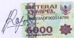
Iffa Roesadie Fatimatuzahra