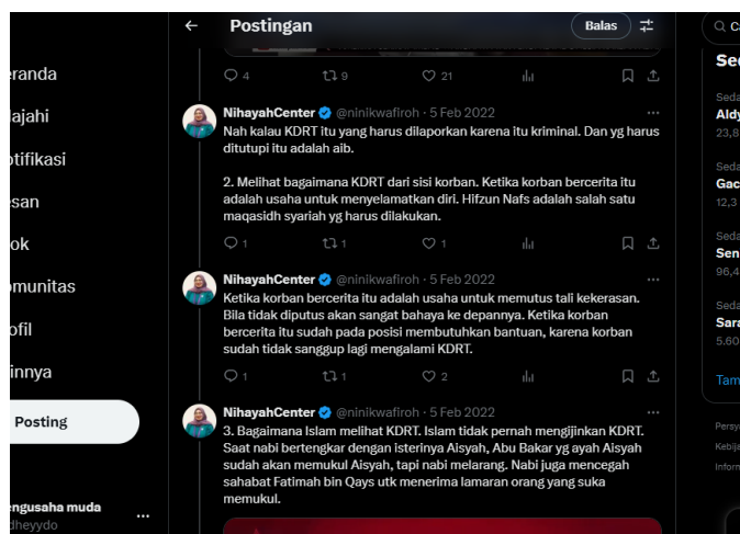
Gambar 4. 4 Tanggapan publik terhadap KDRT sebagai aib sosial dan bentuk penyelamatan diri (Twitter: @niniqwafiroh)