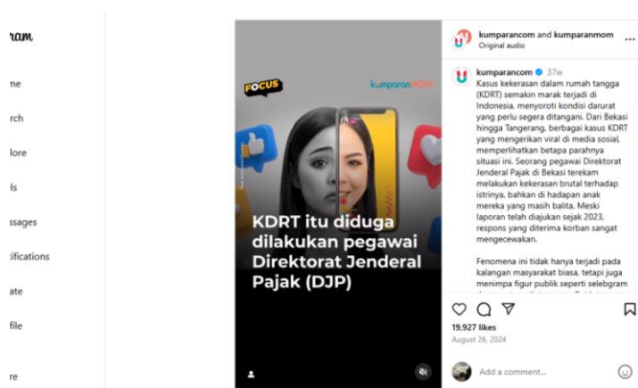
Gambar 4. 2 Contoh unggahan viral media sosial tentang KDRT (@kumparanmom)

Diskusi ini juga menunjukkan tantangan dalam menciptakan diskursus publik yang inklusif di media sosial. Fokus yang berlebihan pada kekerasan fisik dapat mengabaikan bentuk-bentuk kekerasan lainnya, seperti kekerasan verbal atau kombinasi verbal-fisik, yang memiliki dampak jangka panjang yang tidak kalah serius. Distribusi ini menyoroti perlunya upaya kampanye yang lebih holistik untuk mencakup berbagai bentuk kekerasan dalam rumah tangga secara proporsional.