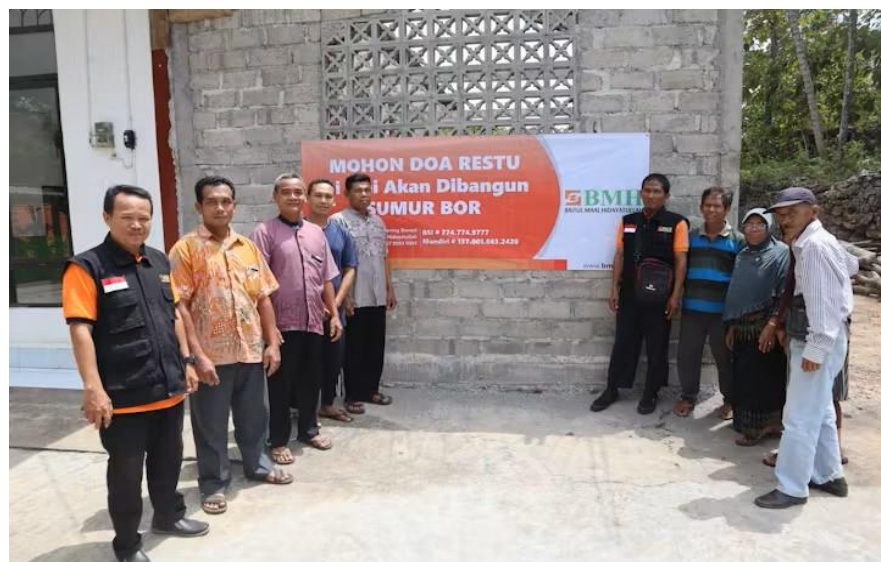
Gambar 5 tempat di bangunnya sumur bor

adalah kebutuhan dasar yang penting untuk kesehatan dan kesejahteraan masyarakat, serta akses yang baik ke air bersih dapat meningkatkan kualitas hidup mereka. Menanggapi krisis ini, BMH menginisiasi program sumur bor sebagai solusi jangka panjang untuk masalah akses air bersih. Program ini dirancang untuk membangun sumur bor di lokasi-lokasi strategis yang membutuhkan. BMH mulai menggalang dana melalui kampanye sosialisasi, donasi online, dan kerjasama dengan berbagai pihak untuk mendukung pembangunan sumur bor. Setelah dana terkumpul, BMH melaksanakan proyek pembangunan sumur bor dengan melibatkan masyarakat setempat, sehingga mereka merasa memiliki dan bertanggung jawab terhadap sumur yang dibangun.