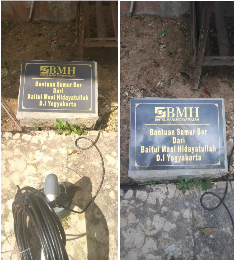
Gambar 10 Sumur Bor dari BMH Kota Yogyakarta