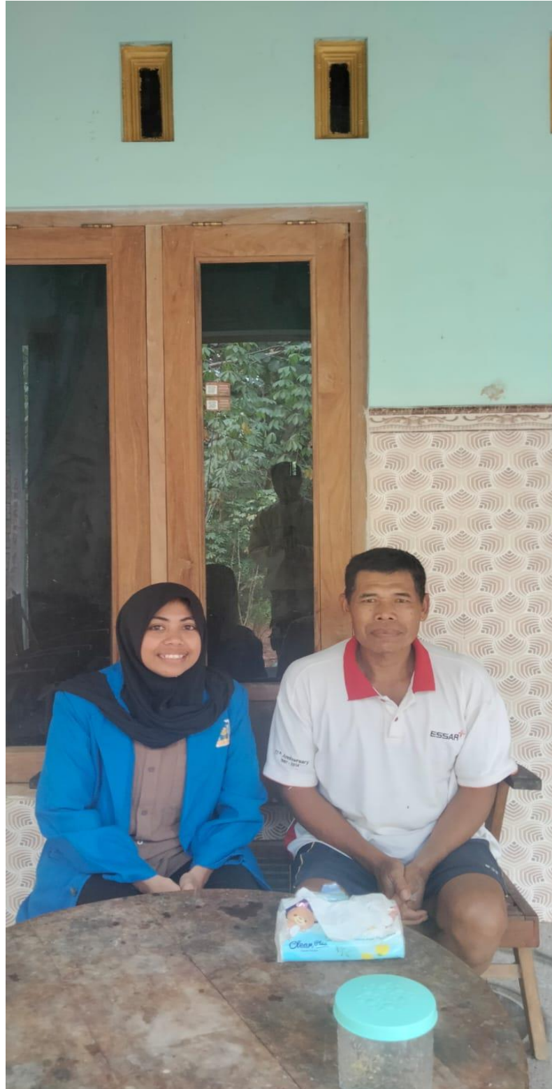
Gambar 6 foto bersma pak RT