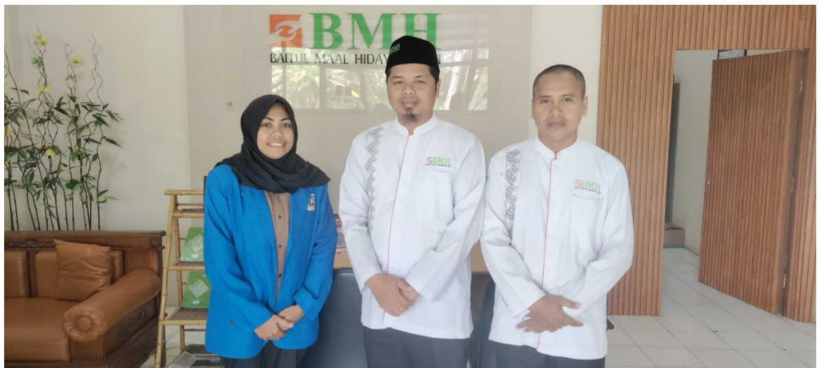
Gambar 12 Bersama pihak dari BMH Yogyakarta