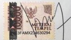
Vira Fatiha Utung