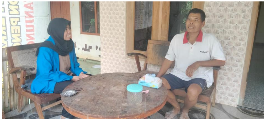
Gambar 7 Proses Wawancara