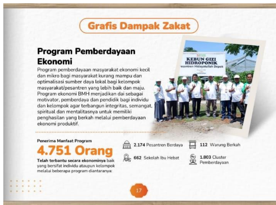
Gambar 4 Program Pemberdayaan Ekonomi