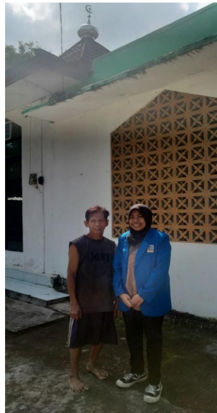
Gambar 8 Wawancara dengan warga sekitar