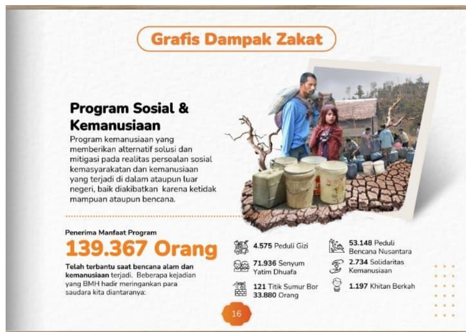
Gambar 1 Program Sosial dan Kemanusiaan