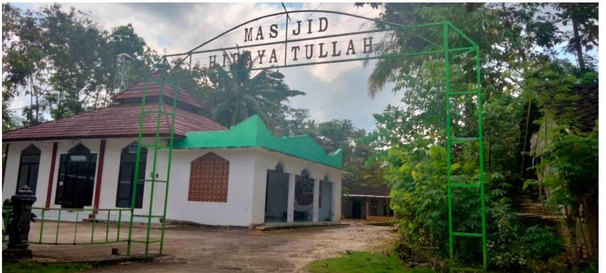
Gambar 11 Masjid Hidayatullah