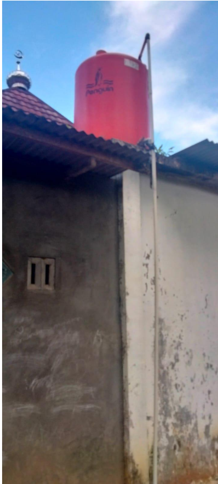
Gambar 9 tandon penampungan air