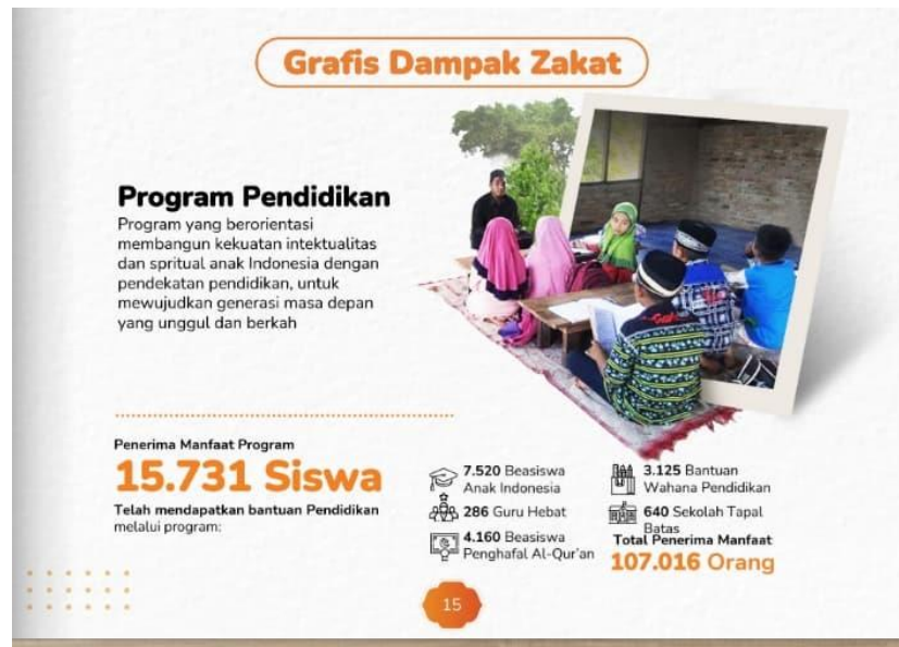
Gambar 2 Program Pendidikan