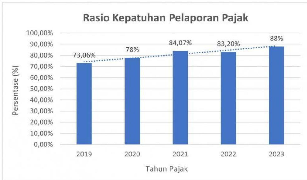
Gambar 1. 1 Rasio Kepatuhan Pelaporan Pajak Selama 5 Tahun Terakhir