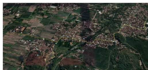
Gambar 4. Trase Eksisting