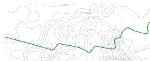
Gambar 6. Alinyemen Horizontal Eksisting