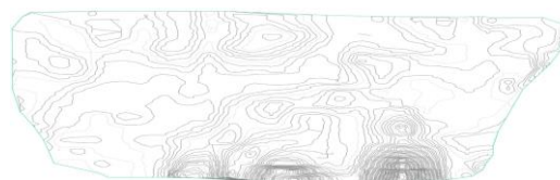
Gambar 3. Kontur

Perlu adanya pembersihan pohon – pohon yang menghalangi jarak pandang di tikungan, perbaikan rambu, pemindahan posisi cermin dan juga pemindahan tiang listrik agar tidak membahayakan pengendara di tikungan. Kontur, trase dan alinyemen dapat dilihat pada gambar 3, 4, 5, 6 dan 7 berikut.