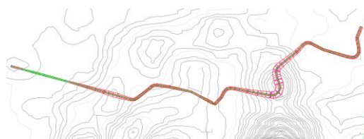
Gambar 7. Alinyemen Horizontal Redesain