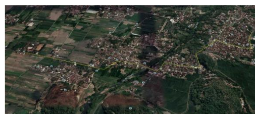
Gambar 5. Trase Redesain