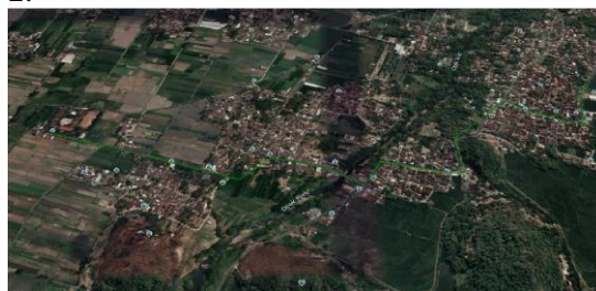
Gambar 2. Peta Lokasi

matikan legenda dan highlight kemudian save gambar tersebut. Selanjutnya import gambar kedalam aplikasi Civil 3D . Tahap terakhir adalah membuat garis referal untuk menyesuaikan skala. Tampilan Google Earth akan terlihat seperti ditunjukkan pada Gambar 2.