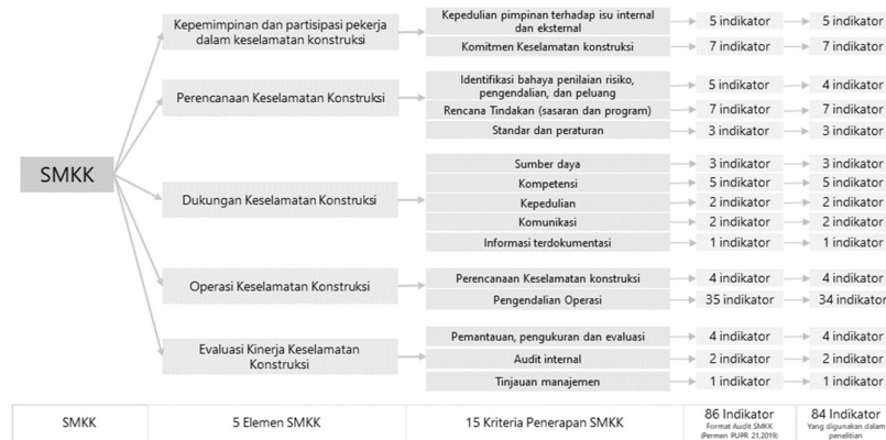
Gambar 1. Indikator Penerapan SMKK yang Digunakan