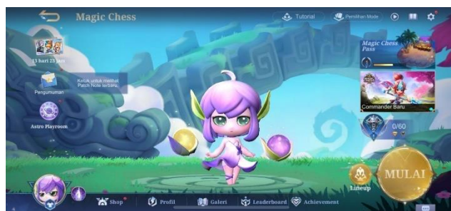
Gambar 2. 9 Lobby Game Magic Chess

Dengan konsep yang unik dan seru, Magic Chess telah menjadi salah satu mode permainan yang populer dalam game online Mobile Legends, menarik pemain untuk mencoba strategi dan taktik mereka dalam pertarungan catur yang berbasis hero