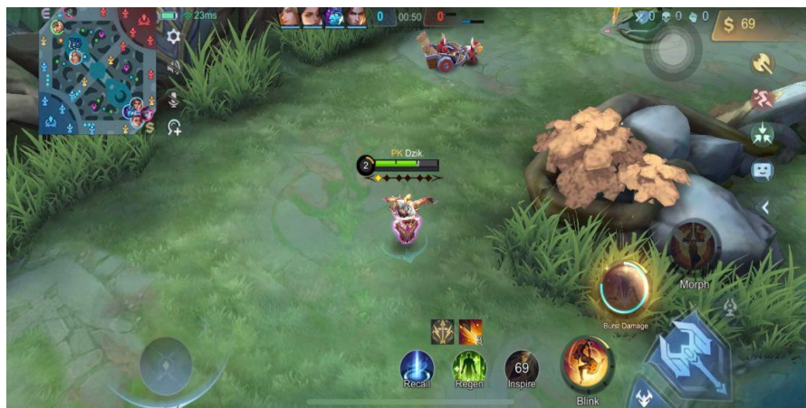
Gambar 2. 14 Game Play 1

Setelah draft pick maka pertandingan akan segera dimulai dengan 25 detik adalah waktu persiapan untuk memulai game. Pada detik-detik awal semua pemain menuju lane nya masing-masing dan pada saat pertandingan berlangsung di saat detik 37 pemain satu menekan tombol simbol request to backup ke pemain ketiga yang dimana si pemain satu memberikan isyarat kepada pemain kedua untuk membantu pemain ketiga kemudian pemain satu dan dua langsung saja menuju lane pemain ketiga yang bertujuan untuk membantu.