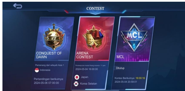
Gambar 2. 12 Lobby Mode Contest

Mode ini sering kali menghasilkan pengalaman permainan yang sangat intens dengan pertempuran sengit antara dua team yang berusaha untuk mendominasi dan mencapai kemenangan kemudian mode ini juga memberikan kesempatan pemain untuk menguji keterampilan individu dan strategi team mereka dalam pertempuran yang kompetitif dimana pemain dapat merasakan sensasi persaingan dan memacu adrenalin bagi pemain yang mencari tantangan.