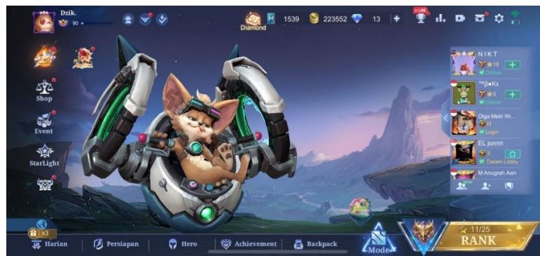
Gambar 2.2 Lobby Game

Game online Mobile Legends adalah game online multiplayer game mobile yang dikembangkan dan diterbitkan oleh Moonton. Game ini dirilis pada tanggal 14 Juli 2016. Game online Mobile Legends termasuk dalam game online seperti Multiplayer Online Battle Arena (MOBA), bersifat strategi dan biasanya dimainkan 5-10 orang dalam 1 kali permainan dan 1 team terdiri dari 5 orang, dimana kedua team harus berjuang untuk mencapai dan menghancurkan base musuh sambil mempertahankan base mereka sendiri untuk mengendalikan jalan setapak, yaitu tiga lane yang dikenal sebagai top, middle, dan bottom, yang menghubungkan basis-basis, genre game ini adalah MOBA yang di desain untuk para pengguna