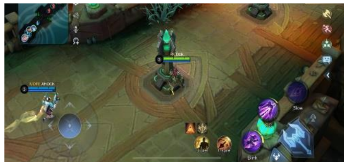
Gambar 2. 8 Tampilan In Game Mode Brawl