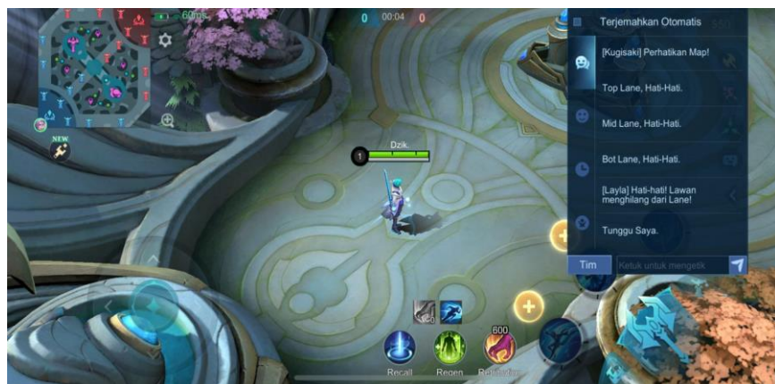
Gambar 2. 18 Non verbal communication

Komunikasi non-verbal dalam game online Mobile Legends terjadi melalui pesan singkat atau quick chat, yang berupa simbol atau tanda yang telah disepakati oleh para pemain game online Mobile Legends. Pesan ini ditujukan untuk memberikan informasi tentang situasi pertandingan yang terjadi di sekitar minimap. Ada beberapa contohnya yaitu: simbol retreat atau initiate retreat yang mengisyaratkan untuk mundur, request backup yang mengisyaratkan untuk meminta bantuan, launch attack yang mengisyaratkan pemain untuk menyerang dan masih banyak lainnya.