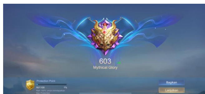
Gambar 2. 4 Perolehan Point Rank