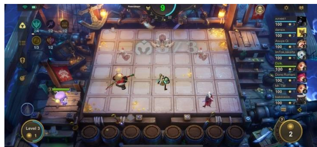
Gambar 2. 11 Game Play Magic Chess