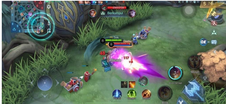
Gambar 2. 15 Game Play 2

Setelah membantu pemain ketiga pemain satu dan dua melakukan rotasi ke atas yang dimana pemain kedua memberikan isyarat kepada pemain kelima untuk menyerang hero lawan “ayo gas aja aku back up” dan pada menit 01:59 pemain kelima berhasil mendapatkan first blood dengan bantuan pemain kedua dan ketiga dan di sisi lain pemain di area bawah atau gold lane terkena pick off oleh team musuh kemudian pada pada menit 02:17 pemain kedua menyuruh pemain pemain keempat untuk membunuh turtle kemudian pemain keempat merespon “retri ku cooldown” kemudian pemain kelima langsung saja melakukan inisiasi untuk membunuh turtle hal hasil turtle dicuri team lawan dan pemain keempat dan kelima berhasil mendapatkan kill dan pada menit 03:08 pemain keempat terbunuh oleh musuh karena pemain keempat berusaha mencuri buff musuh, jika mencuri buff musuh, musuh tidak akan membiarkan pemain lain untuk mencuri buff nya padahal sebelumnya pemain keempat menyuruh pemain ke satu untuk memback up untuk mencuri buff musuh namun tidak ada respon apapun yang diberikan pemain kesatu.