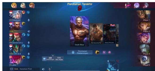
Gambar 2.3 Draft Pick Rank