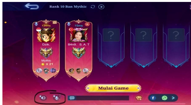
Gambar 2. 17 Vocal Communication

Pada saat bermain game online Mobile Legends team UII Esport Community tidak hanya komunikasi teks saja yang dapat dilakukan ada juga beberapa fitur juga yang memudah pemain untuk berkomunikasi seperti fitur voice chat . Komunikasi yang terjadi yaitu menggunakan suara tanpa perlu membuang-buang waktu untuk mengetik, komunikasi melalui voice chat ini sangat efisien. Komunikasi melalui fitur voice chat ini hanya dapat didengar oleh teman satu team dan lawan tidak dapat mendengar apa yang diucapkan.