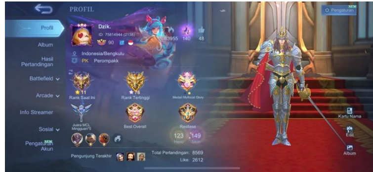
Gambar 2.1 Profil Akun