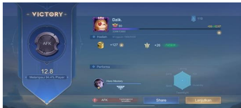
Gambar 2. 6 Gambar Hasil Akhir Classic