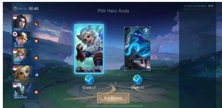
Gambar 2. 7 Draft Pick Brawl

menarik bagi para pemain yang mencari tantangan dan kecepatan dalam pertempuran.