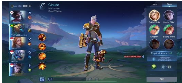
Gambar 2. 5 Gambar Draft Pick Classic

player untuk mengetahui seberapa orang tersebut menguasai hero tersebut dan semakin besar win ratenya semakin bagus dan jago dia memainkan hero tersebut.