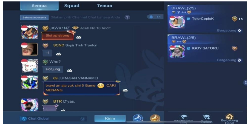
Gambar 2. 16 Pesan Tertulis

chat squad, chat personal antara player ke player yang lainnya ada juga komunikasi yang terjadi pada saat game berlangsung seperti chat team dan chat all .