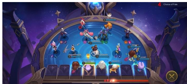
Gambar 2. 10 Draft Pick Magic Chess