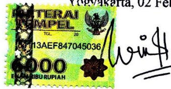
Winda Pramestining Tiyas