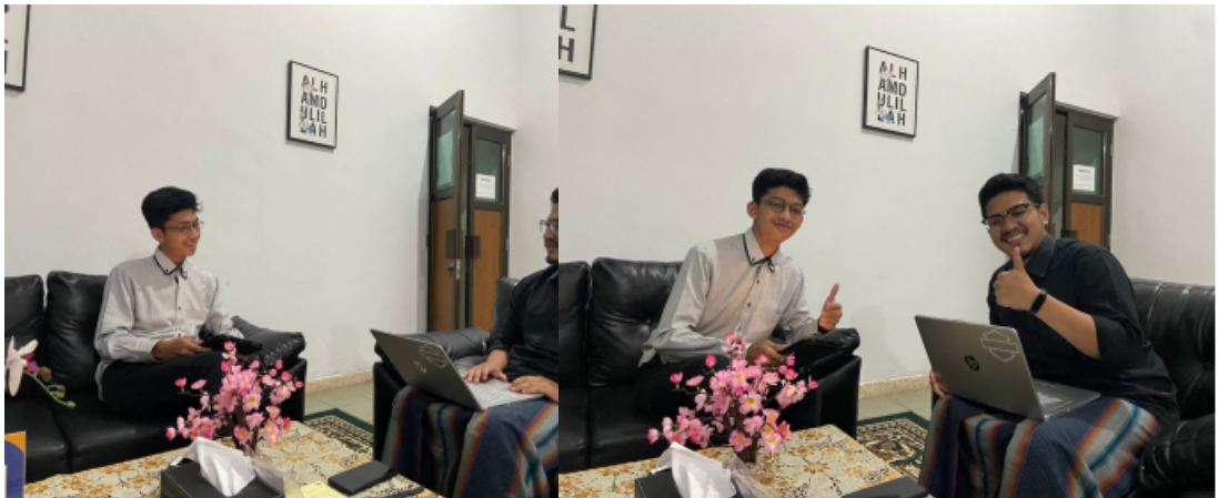
Dokumentasi wawancara bersama ketua takmir masjid Ulil Abab UII