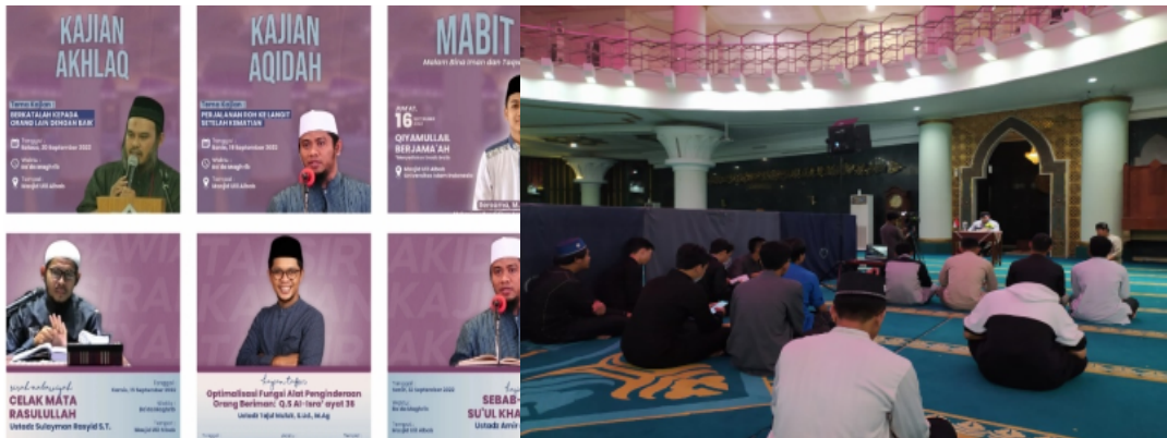
Dokumentasi Kegiatan Kajian Rutin Masjid Ulil Albab UII