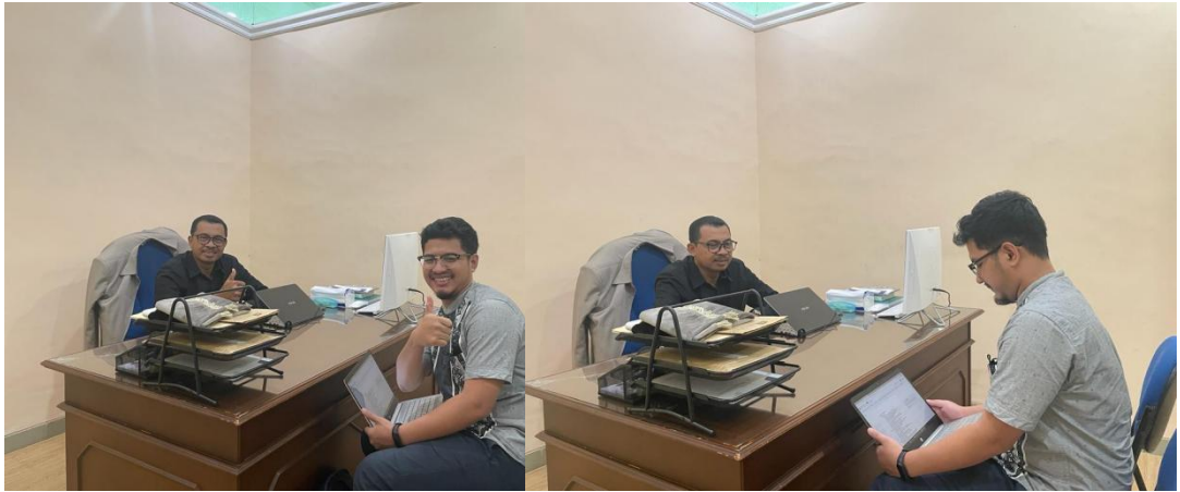
Dokumentasi wawancara bersama Direktur DPPAI UII