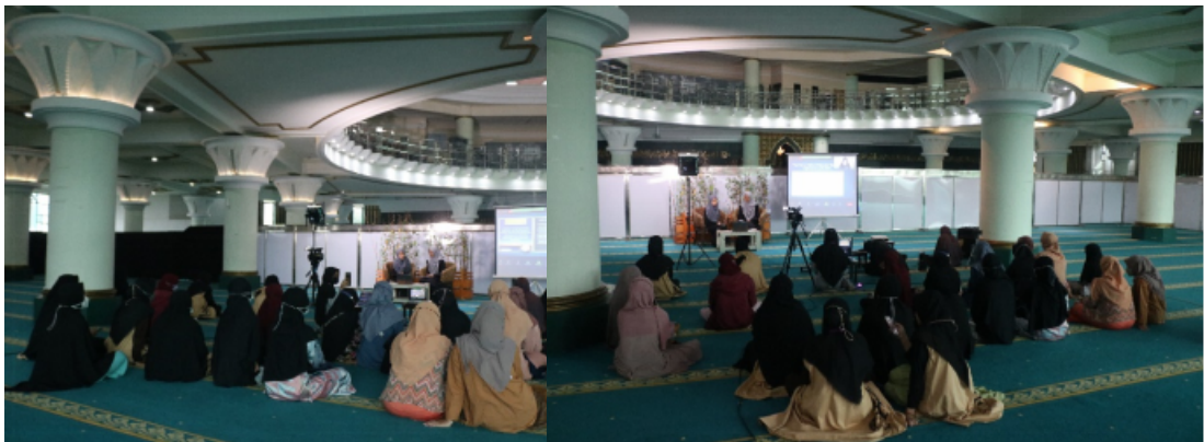
Dokumentasi kegiatan kajian kemuslimahan Masjid Ulil Albab UII