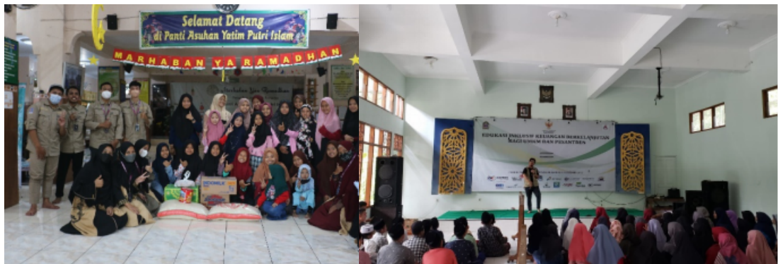
Dokumentasi suasana kegiatan pemberdayaan keagamaan dan motivasi di panti asuhan