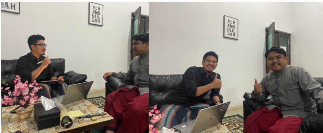
Dokumentasi wawancara bersama ketua divisi Relasi Publik takmir masjid Ulil Abab UII