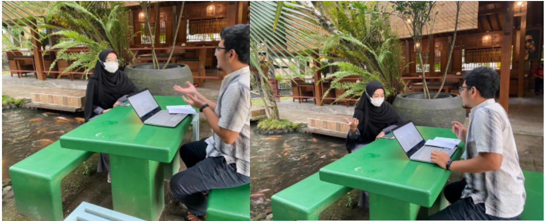
Dokumentasi wawancara bersama Jamaah masjid Ulil Abab UII