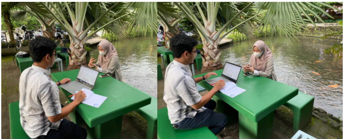
Dokumentasi wawancara bersama Jamaah masjid Ulil Abab UII