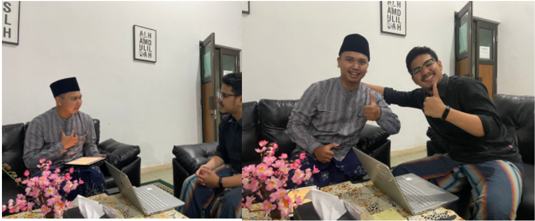
Dokumentasi wawancara bersama ketua divisi Syiar takmir masjid Ulil Albab UII