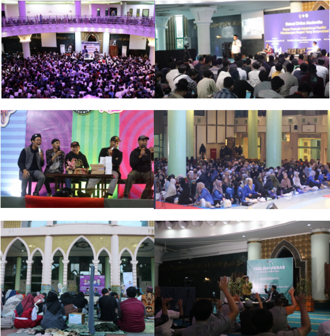
Dokumentasi Kegiatan Kajian Mempertingati Hari Besar Islam Masjid Ulil Albab