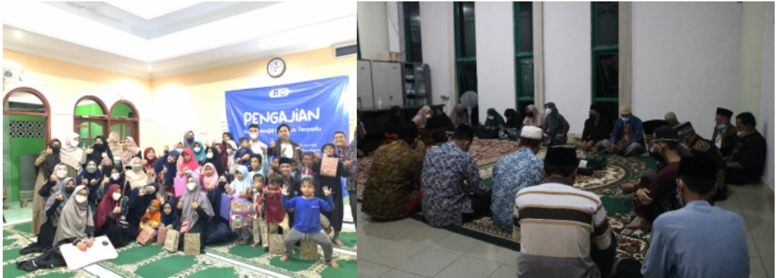
Dokumentasi Kegiatan Kajian IMKT (Ikatan Masjid Kampus Terpadu)