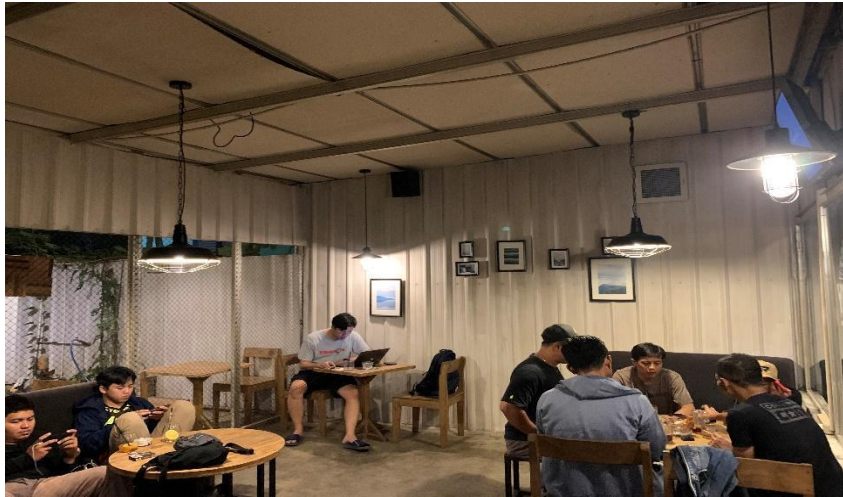
Gambar 3.2 Desain Ruang indoor.