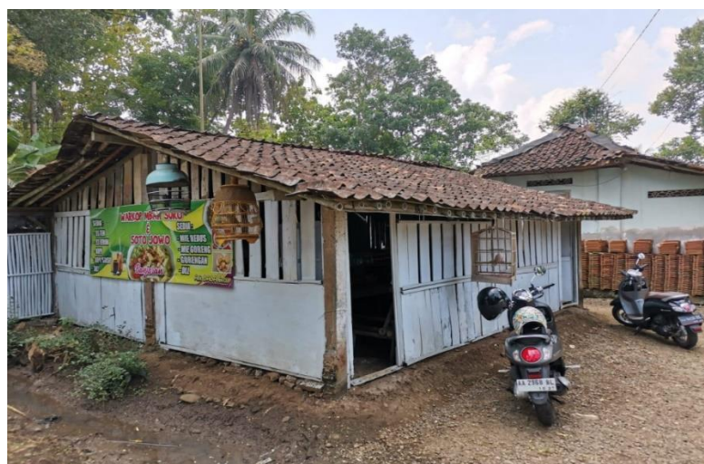
Gambar 3.1 Desain ruangan umum warung Mbah S.