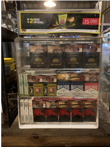
Gambar 3.4 Etalase Rokok.

Peneliti juga melakukan observasi dan wawancara dengan sang owner menu hidangan dan selera customer yang memesan kopi apa saja yang disajikan oleh kafe ini. Terkadang ketika membahas selera tidak hanya berkaitan dengan menu yang ada dalam kafe tersebut, melainkan juga teman pendamping ketika mereka sedang nongkrong dan minumn kopi. Seperti rokok yang sudah di bahas sebelumnya. Disisi lain untukuk menu kopi dalam kafe ini apakah hanya ada seduhan kopi sederhana atau kafe ini sudah melakukan perkembangan sesuai zaman yang saat ini sudah banyak sekali hidangan kopi dengan berbagai jenisnya dan inovasi baru soal teknik menyeduh kopi. Mas A pun mejelaskan selera minuman customer selama mereka mengunjungi Rookie Caffé melalui pandangan owner Rookie caffe: