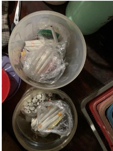
Gambar 3.3 Tempat Rokok Menyan.

yo akehe sing teko bapak-bapak, yo pesene nek tak mat-matke yo kopi ireng pait, tak seduh biasa mas.”