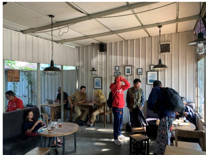
Gambar 3.4 Kondisi Rookie Caffe Siang Hari. Pada hari Senin tanggal 22 April 2022 Pukul 13.45 WIB.

Pada hari Senin tanggal 22 April 2022 Pukul 13.45 WIB, peneliti kembali mengunjungi Rookie Caffe untuk melakukan observasi. Menurut Lefebvre (1991) suatu ruang sosial dihasilkan oleh tiga rangkaian konseptual atas ruang tersebut. tiga rangkaian konseptual tersebut ialah Praktik Spasial ( Spatial Practices ), Representasi Ruang ( Representations of Space ), dan Ruang Representasional ( Representational Space ). Peneliti menemukan data dilapangan dengan menggunakan dua dari rangkaian konseptual, Representasi Ruang ( Representations of Space ) dan Ruang Representasional ( Representational Space ). Lefebvre (1991) Representasi Ruang ( Representations of Space ) adalah representasi terhadap ruang ada kaitanya dengan pola hubungan produksi dan tatanan yang memiliki tujuan untuk memaksakan suatu pola hubungan tertentu atas “pemanfaatan” suatu ruang. Representasi-representasi yang dihasilkan oleh ruang tertentu dapat menjadi beragam dalam hal-hal tersebut merujuk terhadap suatu ruang yang telah “dikonsepsikan”. Dalam penelitian ini melihat representasi ruang berdasarkan keadaan yang ada di Rookie Caffe. Ternyata selama peneliti berulang kali mengunjungi Rookie Coffeshop memang ruang ini sesuai dengan kaum apapun dan gender apapun. Tidak hanya berfokus pada satu golongan. Jadi Rocckie Coffeshop nyaman dan aman untuk semua golongan, terutama golongan anak muda yang ada di Kota Purworejo.