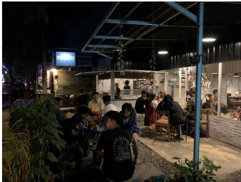
Gambar 3.1 Desain ruangan umum semi outdoor.