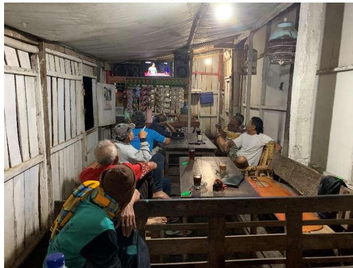
Gambar 3.3 Kondisi Warung Kopi Mbah.

Space ) adalah representasi terhadap ruang ada kaitanya dengan pola hubungan produksi dan tatanan yang memiliki tujuan untuk memaksakan suatu pola hubungan tertentu atas “pemanfaatan” suatu ruang. Representasi-representasi yang dihasilkan oleh ruang tertentu dapat menjadi beragam dalam hal-hal tersebut merujuk terhadap suatu ruang yang telah “dikonsepsikan”. Dalam penelitian ini melihat representasi ruang berdasarkan keadaan yang ada di Warung Kopi Mbah S menjadi tempat yang sesuai dengan kaum golongan bapak-bapak di Kota Purworejo. Adapun anak muda yang datang pasti bergender pria.