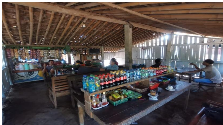
Gambar 3.2 Desain Interior Warung Kopi Mbah S.