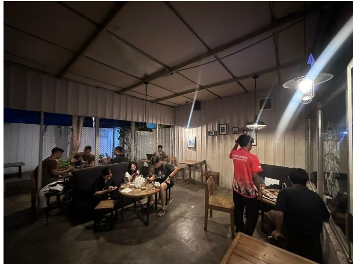
Gambar 3.5 Kondisi Rookie Caffe Malam Hari. Pada hari Rabu tanggal 6 Mei 2024 Pukul 20.35 WIB.