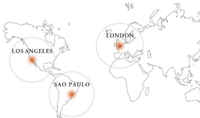
Gambar 1: Peta persebaran Japan House