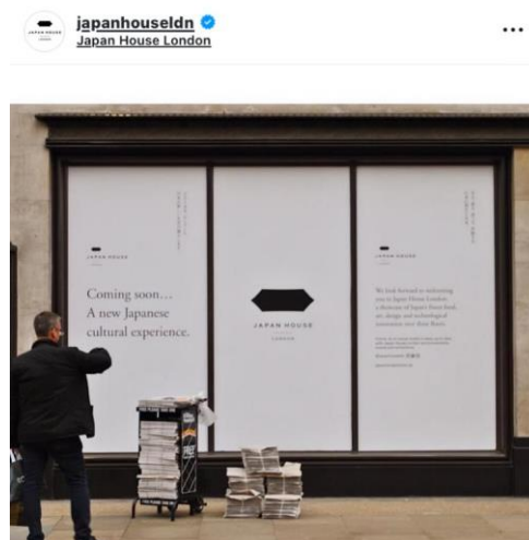
Gambar 2: Postingan ‘Opening’ JHL

Bergerak dari terbentuknya Japan House yang pertama di Sao Paulo, Brazil pada April 2017, jejaring ini kemudian dilanjutkan dengan terbentuknya Japan House London , yang diresmikan pada Juni 2018 (Japan House London 2018). Melalui hal ini, Grand Opening Japan House London dilaksanakan pada tanggal 13 September 2018, dengan dihadiri oleh Duke of Cambridge serta H.E. Mr. Taro Aso selaku wakil perdana Menteri Jepang (MoFA 2018).