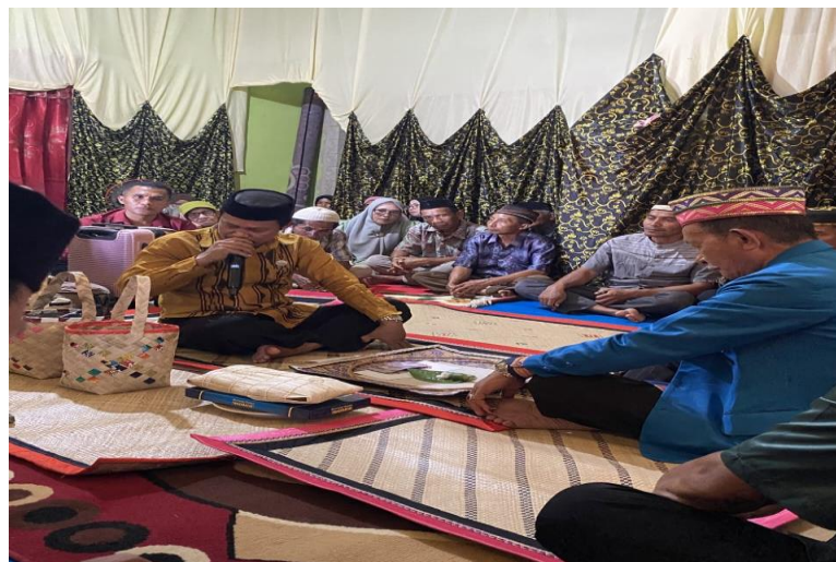
Gambar 2.2 Dokumentasi pelaksanaan tradisi perkawinan Kalosara