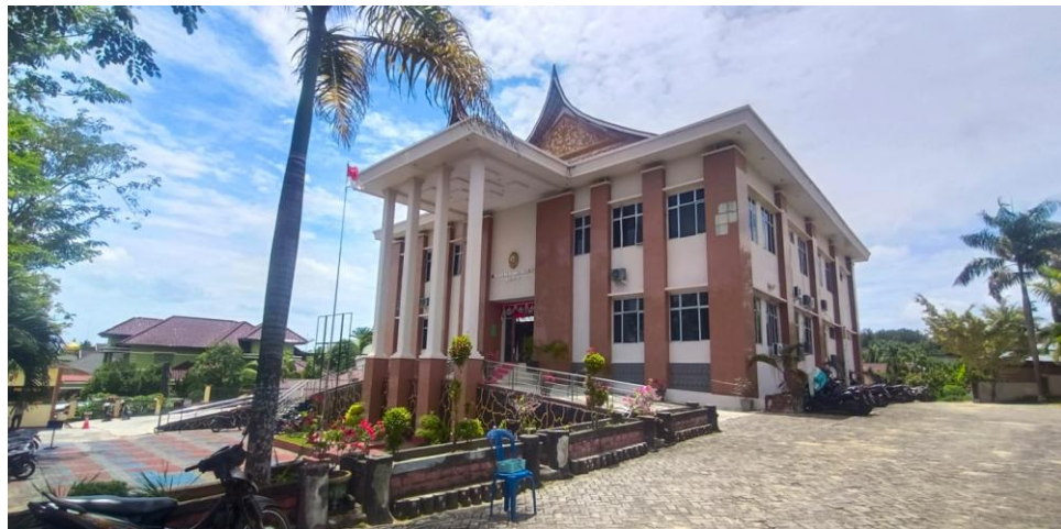
Gambar 1. Kantor Pengadilan Agama Bangkinang Kelas 1 B