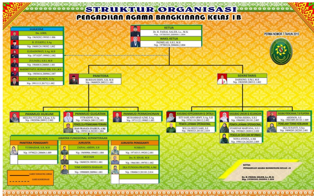
Gambar 2. Struktur Organisasi Pengadilan Agama Bangkinang Kelas 1 B