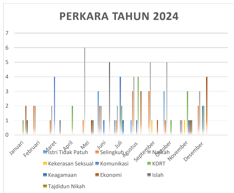
Grafik 4.3 Data Laporan Perkara yang Diterima BP4 Kapanewon Depok Tahun 2024

Selanjutnya kasus aduan yang diterima oleh BP4 Kapanewon Depok pada tahun 2024 adalah sebagai berikut: