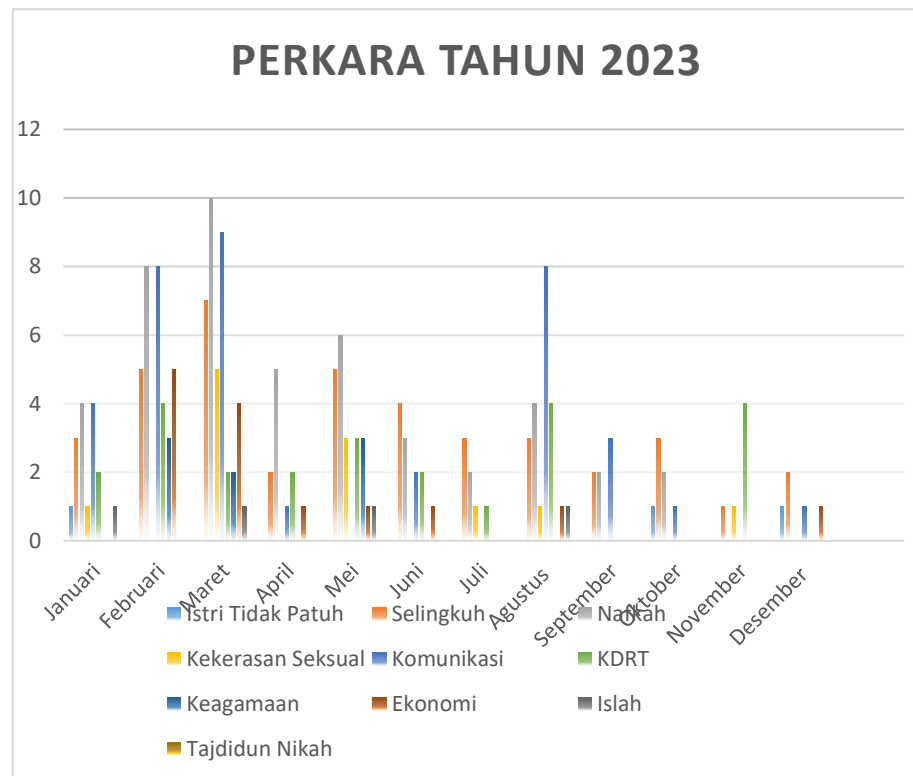
Grafik 4.2 Data Laporan Perkara yang Diterima BP4 Kapanewon Depok Tahun 2023

Selanjutnya data yang diterima BP4 Kapanewon Depok pada tahun 2023 adalah sebagai berikut: