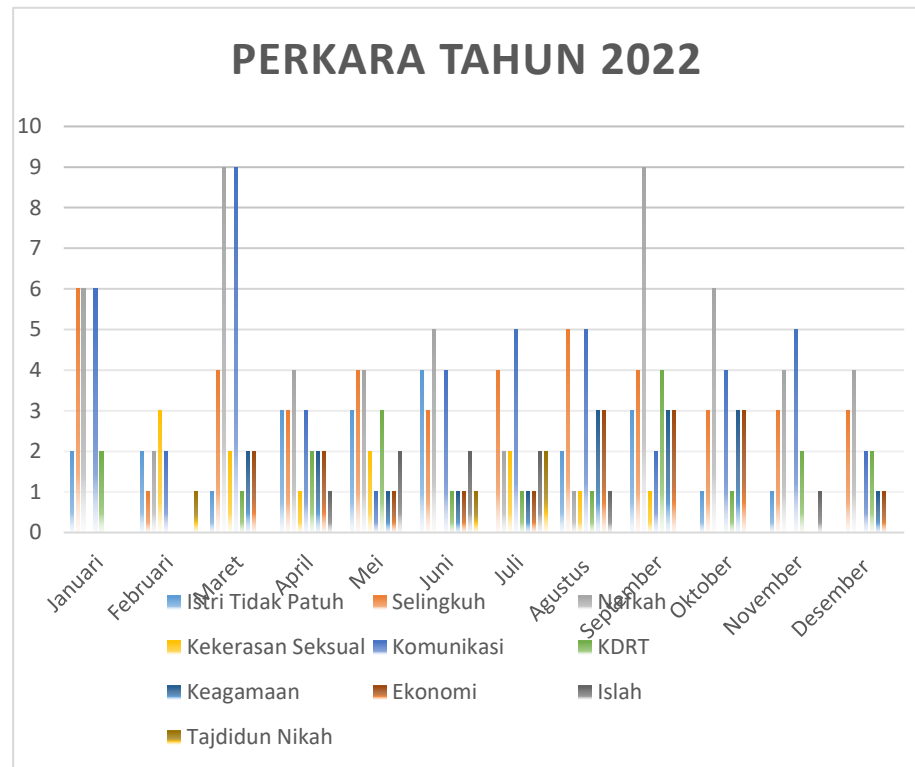
Grafik 4.1 Data Laporan Perkara yang diterima BP4 Kapaewon Depok Tahun 2022