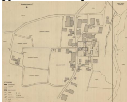
Gambar 1. Denah lokasi Situs Warungboto 2009