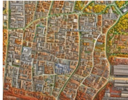
Gambar 2. Denah lokasi Situs Warungboto 2023

Perbedaan yang mencolok terlihat pada denah Situs Warungboto antara tahun 2009 dan 2023, khususnya dalam transformasi lahan dari sawah-sawah pada tahun 2009 menjadi area perumahan penduduk pada tahun 2023. Perubahan serupa juga terlihat di sekitar situs Warungboto itu sendiri.