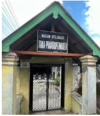
Gambar 7. Area Sakral: Makam Keluarga