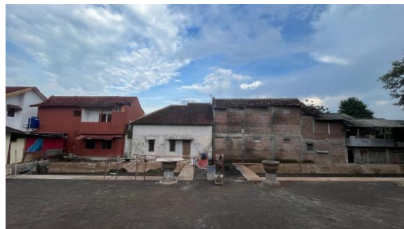
Gambar 6. Pemugaran Warungboto