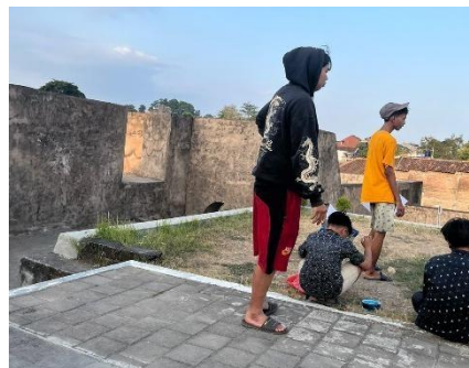
Gambar 5. Area Open Spaces