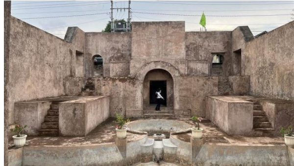
Gambar 4. Pemandian Warungboto

Di Situs Warungboto, ruangan sakral di depan pemandian seringkali menjadi tempat ketidakpatuhan etika pengunjung, terlihat dari beberapa orang yang cenderung memanjat bangunan untuk mengambil foto. Selain itu, anak-anak warga Warungboto sering bermain layangan di open space , yang menyebabkan penumpukan sampah benang layangan di sekitar area tersebut. Selain itu, adanya proyek pemugaran yang belum selesai juga berdampak pada kurangnya minat wisatawan untuk mengunjungi Situs Warungboto.