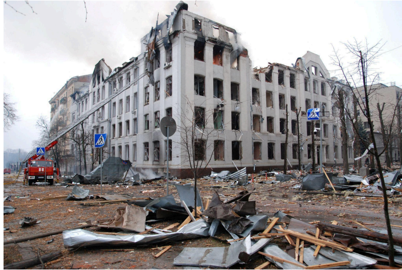
Gambar 2.3. Wilayah Kharkiv setelah digempur oleh pasukan Chechnya dan Rusia