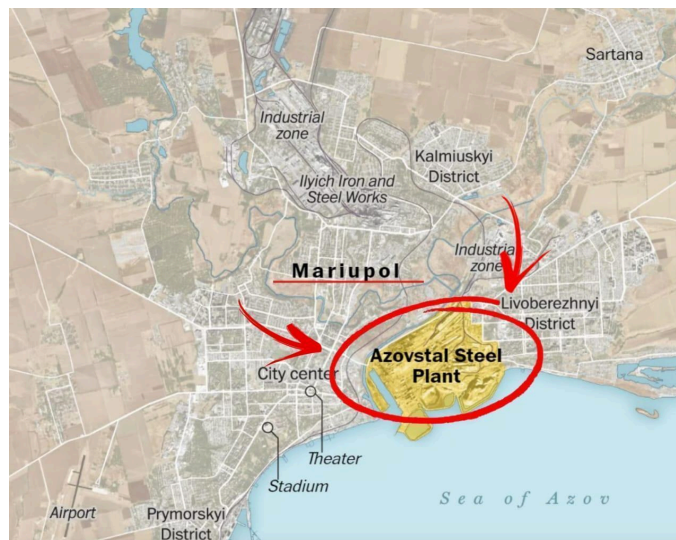
Gambar 2.2. Pengepungan Mariupol dengan Menguasai Pabrik Azovstal

potensi pemberontakan atau perlawanan dari pasukan Ukraina. Informasi intelijen yang terperinci, termasuk foto-foto yang diduga sebagai penjahat Ukraina, berfungsi untuk memotivasi dan memfokuskan pasukan Chechnya pada misi mereka. Persiapan yang matang dan kolaborasi taktik ini menggarisbawahi sejauh mana Ramzan dan pasukannya bersedia melakukan apa pun untuk memastikan keberhasilan tujuan militer mereka, mengukuhkan peran Chechnya sebagai sekutu penting dalam strategi geopolitik Rusia (Cahyani, 2022).