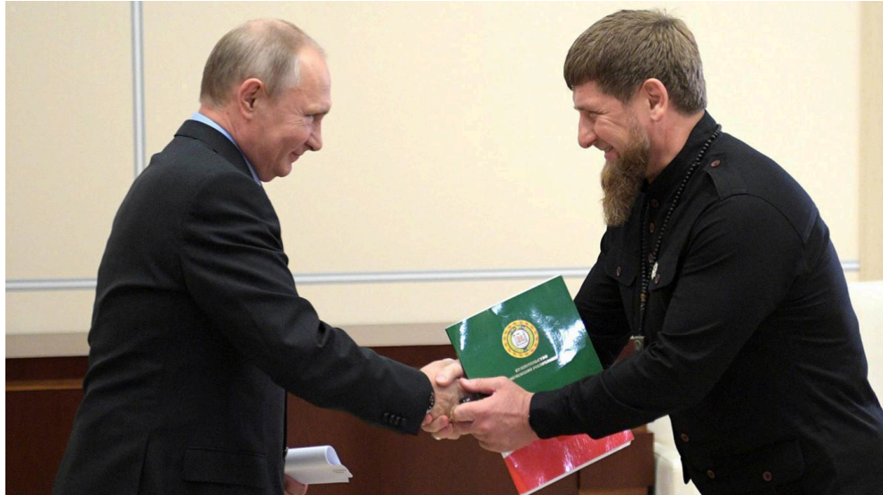
Gambar 2.1. Vladimir Putin dan Ramzan Kadyrov Bertemu