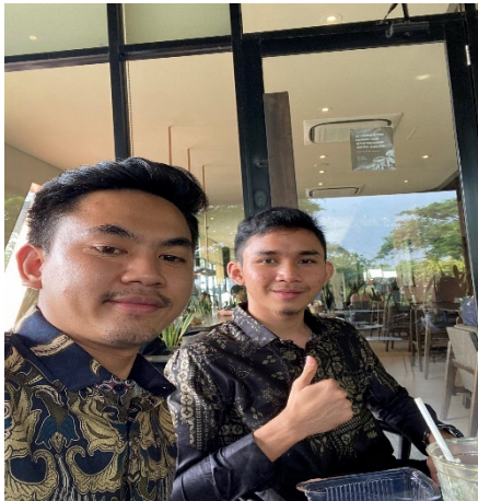
Wawancara Bersama ust ikhlas