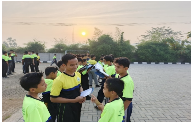
Gambar 2. Kegiatan Santri Senior Mengawasi Muhadatsah Kelas 1 Mts di Pesantren Darunnajah Cipining

setelah itu pengurus bagian bahasa akan memberikan tema yang diusung untuk menjadi topik percakapan para santri. Bukan hanya itu, Seluruh santri juga dikontrol langsung oleh dewan guru pengurus bagian bahasa yang lainnya hal ini agar memastikan bahwasannya seluruh para santri mengikuti kegiatan muhadatsah dengan baik dan fokus.