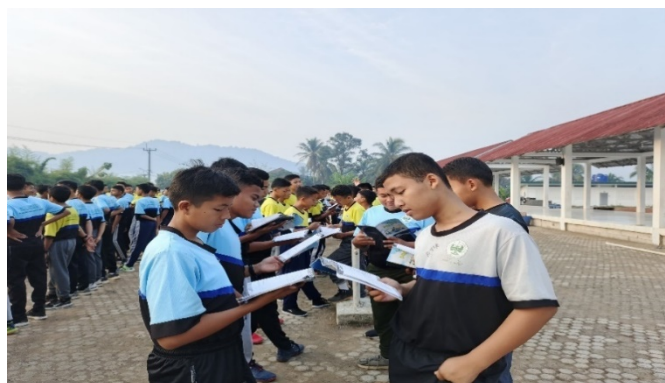
Gambar 1. Kegiatan Muhadatsah di Pesantren Darunnajah Cipining

Kegiatan ini dipimpin langsung oleh Pengurus Bagian Bahasa OSDC (Orgatigo tegarsi Santri Darunnajah Cipining) di bawah pengawasan guru bagian bahasa. Adapun kegiatan Muhadatsah diadakan setiap hari Jum'at pagi setelah para santri melaksanakan shalat shubuh berjama'ah dan mendengarkan nasehat dari pimpinan pesantren, baik putra maupun putri di tempat yang telah ditentukan.