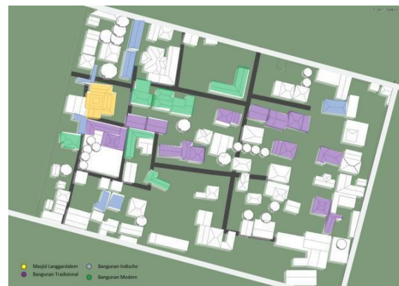
Gambar 5. Mapping Bangunan Tradisional, Modern, dan Indische