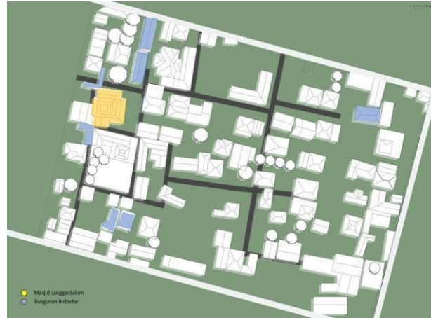
Gambar 6. Mapping Bangunan Indische