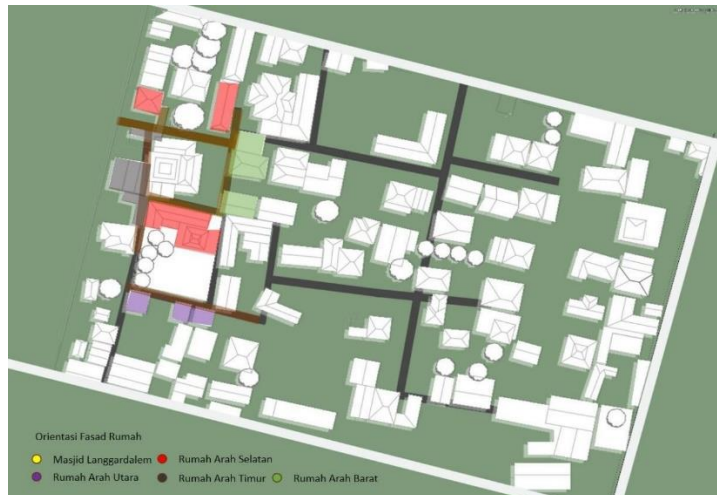
Gambar 12. Mapping Orientasi Fasad Rumah

Setelah melakukan observasi secara langsung dan wawancara dengan warga menurut kepercayaan warga sekitar rumah yang menghadap masjid dan dekat dengan masjid dapat memberikan keberkahan bagi penghuninya dan memudahkan penghuni rumah untuk melakukan kegiatan ibadah seperti shalat dan mengaji. Pada penelitian ini dilakukan mapping dengan menentukan titik rumah sesuai dengan arah mata angin dan Masjid Langgardalem sebagai pusat objek. Didapatkan hasil pada orientasi timur 4 rumah, utara 3 rumah, barat 3 rumah dan selatan 3 rumah dalam radius 500 meter dari Masjid Langgardalem. Rumah-rumah disekitar Masjid Langgardalem beberapa memiliki fasad atau pintu utamanya mengarah ke arah masjid, namun tidak semua fasad atau pintu rumah menghadap ke arah masjid. Misalnya, pada bangunan di Gambar 7.0 memiliki fasad atau pintu utama di sisi timur yang menghadap ke arah masjid. Rumah ini memiliki ciri khas arsitektur Indische dengan aksent pintu berwarna biru dan cat dinding berwarna putih.