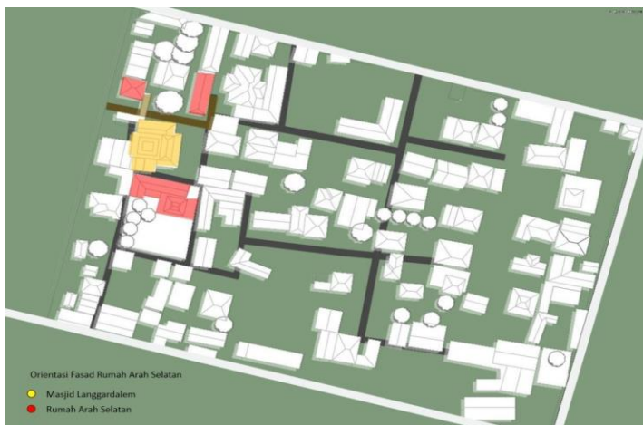
Gambar 11. Mapping Orientasi Selatan