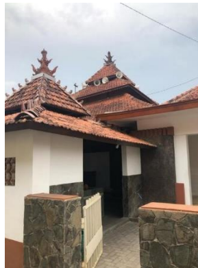
Gambar 13. Sisi Barat Masjid Sumber : Foto Pribadi Fajar Solichin (2023)

Setelah melakukan observasi secara langsung dan wawancara dengan warga menurut kepercayaan warga sekitar rumah yang menghadap masjid dan dekat dengan masjid dapat memberikan keberkahan bagi penghuninya dan memudahkan penghuni rumah untuk melakukan kegiatan ibadah seperti shalat dan mengaji. Pada penelitian ini dilakukan mapping dengan menentukan titik rumah sesuai dengan arah mata angin dan Masjid Langgardalem sebagai pusat objek. Didapatkan hasil pada orientasi timur 4 rumah, utara 3 rumah, barat 3 rumah dan selatan 3 rumah dalam radius 500 meter dari Masjid Langgardalem. Rumah-rumah disekitar Masjid Langgardalem beberapa memiliki fasad atau pintu utamanya mengarah ke arah masjid, namun tidak semua fasad atau pintu rumah menghadap ke arah masjid. Misalnya, pada bangunan di Gambar 7.0 memiliki fasad atau pintu utama di sisi timur yang menghadap ke arah masjid. Rumah ini memiliki ciri khas arsitektur Indische dengan aksent pintu berwarna biru dan cat dinding berwarna putih.