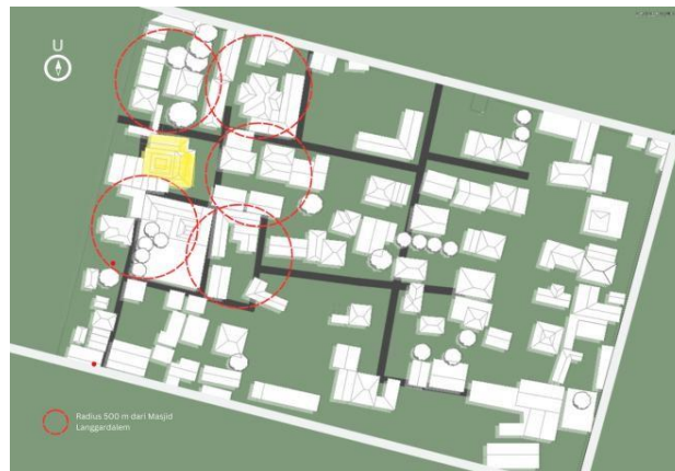
Gambar 7. Mapping Radius Penelitian

Pada penelitian ini dilakukan mapping peta dan membuat radius sebesar 500 meter dari Masjid Langgardalem untuk mengidentifikasi orientasi pemukiman dan rumah disekitar Masjid Langgardalem sebagai objek penelitian arsitektur berdasarkan elemen kawasan landmark dan permukiman. Akses menuju Masjid Langgardalem dapat melalui Jl. Gang 2 terdapat jalan kecil menuju lokasi Masjid Langgardalem.