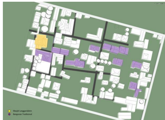
Gambar 4. Mapping Bangunan Tradisional