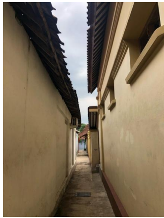
Gambar 15. Salah satu jalan menuju pemukiman