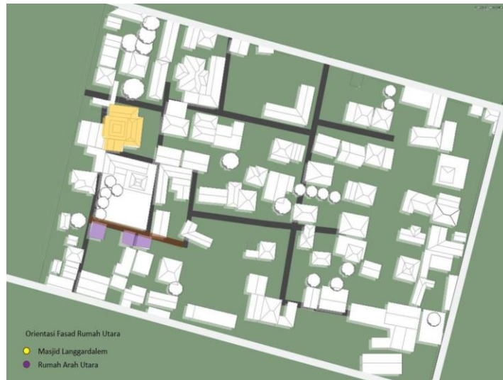
Gambar 9. Mapping Orientasi Utara