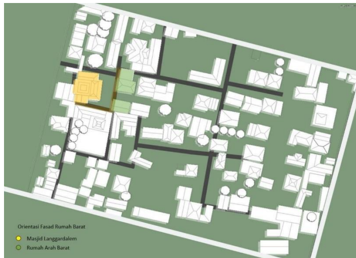
Gambar 10. Mapping Orientasi Barat