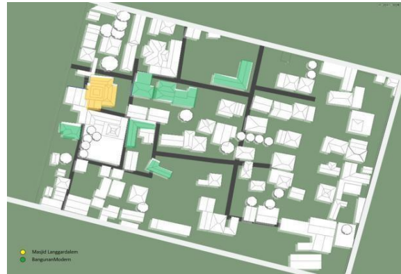
Gambar 3. Mapping Bangunan Modern

memiliki nilai sejarah di kawasanya dan menjadikan kawasan Masjid Langgardalem memiliki keunikan dan menjadi Landmark lain setelah Masjid Al-Aqsha. Tersebar nya jenis rumah yang melewati masa ke masa yakni dari rumah tradisional jawa, indische (Hindia-Belanda) hingga modern. Keragaman jenis atau tipologi dari ketiga masa ini menjadikan bangunan atau rumah yang ada dikawasan ikut terdampak dari sisi elemen, ornamen, hingga material bangunan.