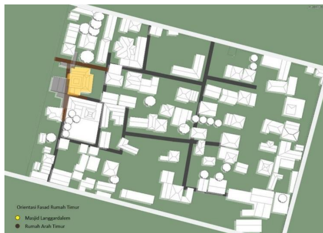
Gambar 8. Mapping Orientasi Timur

Pada penelitian ini dilakukan mapping peta dan membuat radius sebesar 500 meter dari Masjid Langgardalem untuk mengidentifikasi orientasi pemukiman dan rumah disekitar Masjid Langgardalem sebagai objek penelitian arsitektur berdasarkan elemen kawasan landmark dan permukiman. Akses menuju Masjid Langgardalem dapat melalui Jl. Gang 2 terdapat jalan kecil menuju lokasi Masjid Langgardalem.