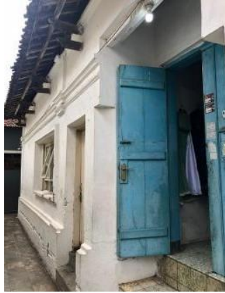
Gambar 14. Salah Satu Rumah Dengan Fasad Menghadap Timur