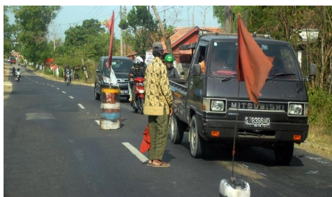
Gambar 2. Dokumentasi Penggalangan Dana Masjid di Jalan Raya Bangkalan

Fenomena penggalangan dana masjid di jalan Bangkalan sebenarnya bukanlah fenomena baru, melainkan sudah terjadi cukup lama. Dari tahun ke tahun tampak ditemukan penambahan jumlah titik penggalangan dana masjid di jalan Bangkalan, baik di jalur utama maupun jalur pesisir selatan jalan Kabupaten Bangkalan-Sampang. Aktivitas penggalangan dana masjid di jalan Bangkalan dilakukan setiap hari, mulai dari sekitar pukul 06: 30 WIB sampai dengan pukul 16.00 WIB. Selama berlangsung, kegiatan ini memanfaatkan berbagai fasilitas seperti sound system atau pengeras suara, spanduk atau baleho yang dipampang di sekitar lokasi, membuat pos-pos kecil dan marka drum atau sejenisnya yang diletakkan secara berjejer di tengah-tengah dua sisi jalan.