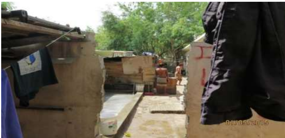
Gambar 2.2 Kondisi Tempat Tinggal Para Pekerja Imigran yang Tidak Layak

Gambar di atas memperlihatkan bahwa, buruknya pemerintah Qatar dalam menyediakan fasilitas asrama tempat tinggal kepada para pekerja imigran. Oleh karena itu, beberapa pekerja imigran mengalami konsekuensi yang sangat buruk dalam kondisi kesehatan para pekerja imigran.