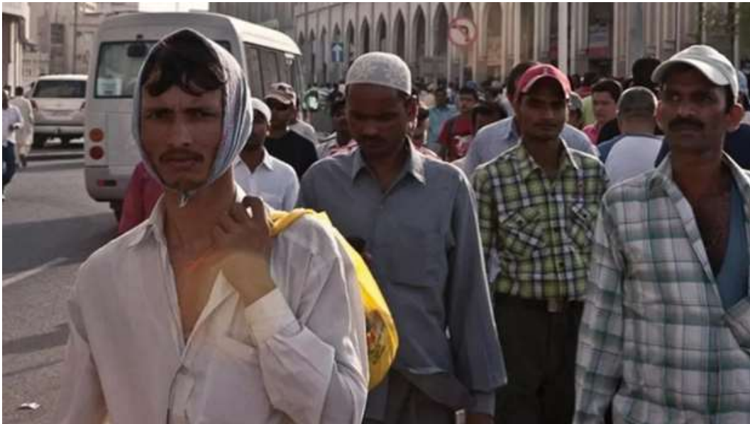
Gambar 2.4 Para pekerja Imigran sedang bekerja di depan Lusail Stadium yang sedang dibangun