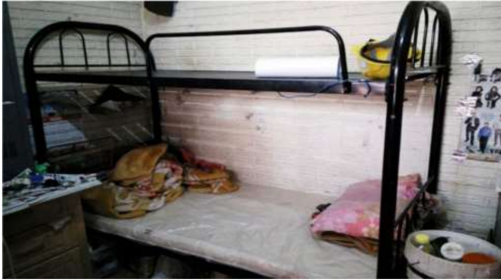
Gambar 2.1 Kondisi Tempat Tidur para Pekerja Imigran