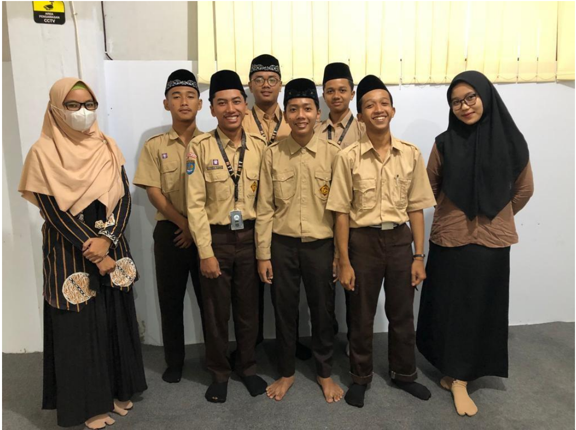
Dokumentasi setelah pelaksanaan wawancara.