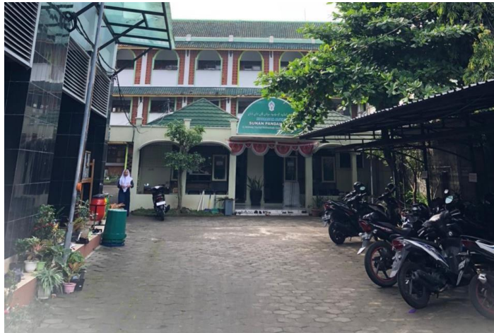
Gambar 4.1 Bangunan Sekolah

Lokasi dan tata bangunan yang sangat bagus membuat suasana pembelajaran menjadi lebih enak. Di Madrasah Aliyah Sunan Pandanaran memiliki 2 bangunan terpisah antaran bangunan gedung putra dan gedung putri. Setiap gedung putra dan gedung putri memiliki 4 lantai kelas.