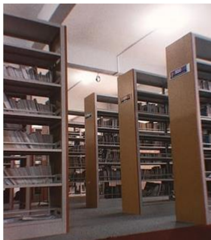
Gambar 4.1 Perpustakaan

Perpustakaan berperan penting di dalam proses pembelajaran di sekolah. perpustakaan merupakan salah satu pendukung proses pembelajaran berjalan dengan lancar. Di Madrasah Aliyah Sunan Pandanaran fasilitas perpustakaan yang lengkap dan banyak buku-buku yang ada di dalam perpustakaan.