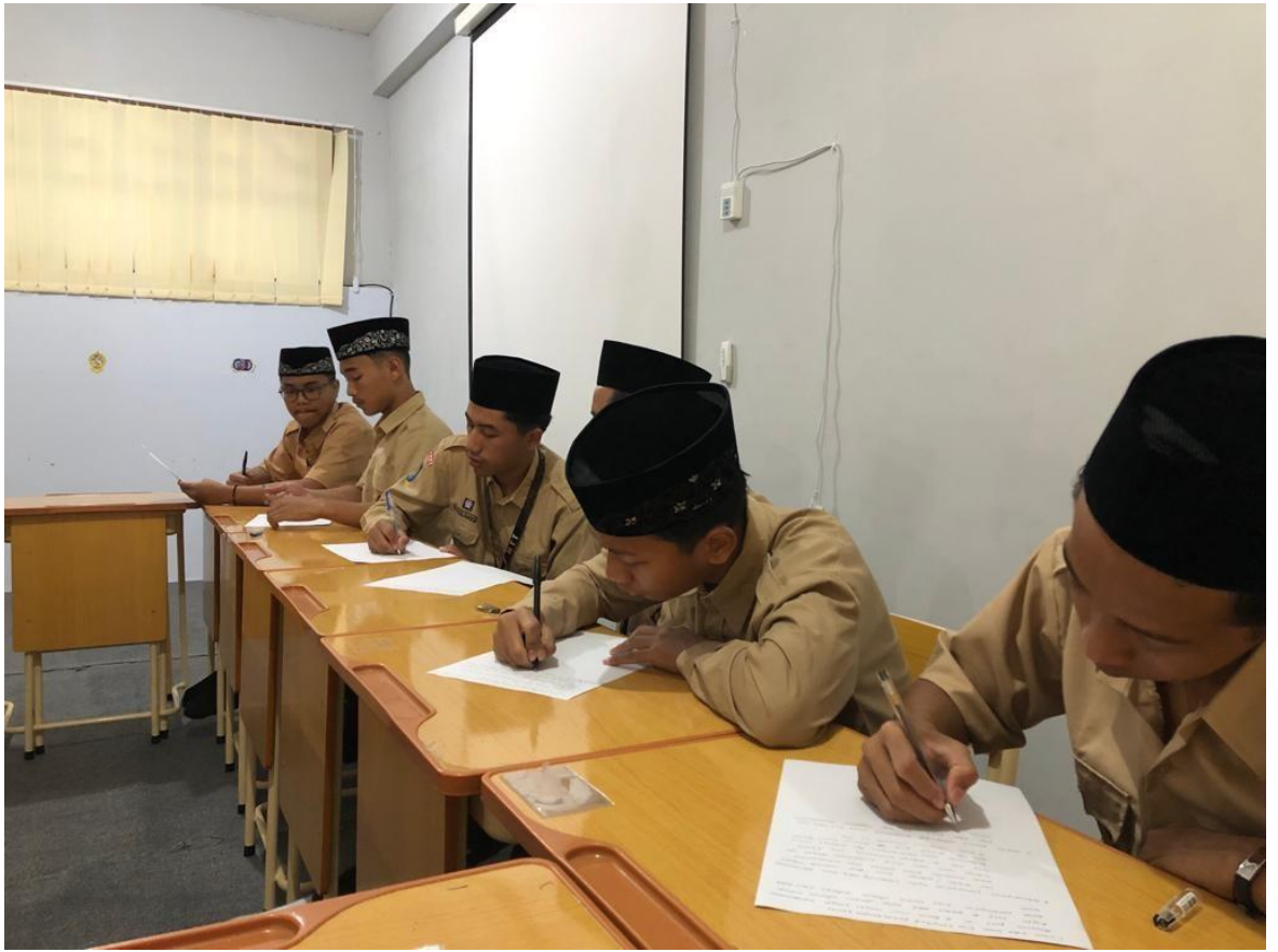
Siswa sedang menjawab instrumen pertanyaan yang diajukan oleh peneliti.