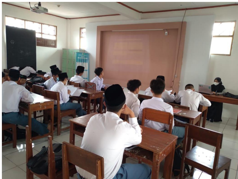
Gambar 4.3 Suasana ruang kelas siswa putra