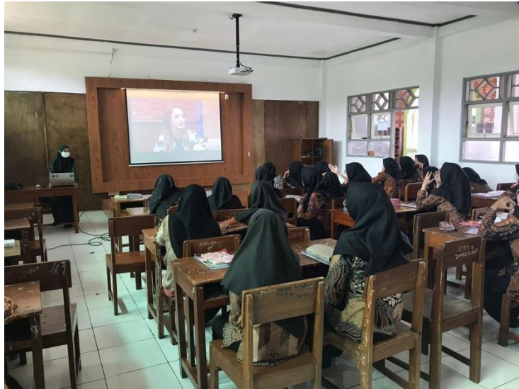
Gambar 4.2 Suasana ruang kelas siswa putri