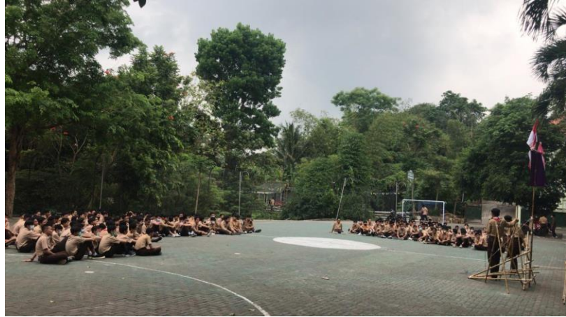
Gambar 4.4 Halaman Sekolah

Tak hanya itu halaman depan juga di gunakan untuk baris dan kegiatan sekolah lainnya.