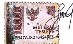
Fardila Indah Ningrum