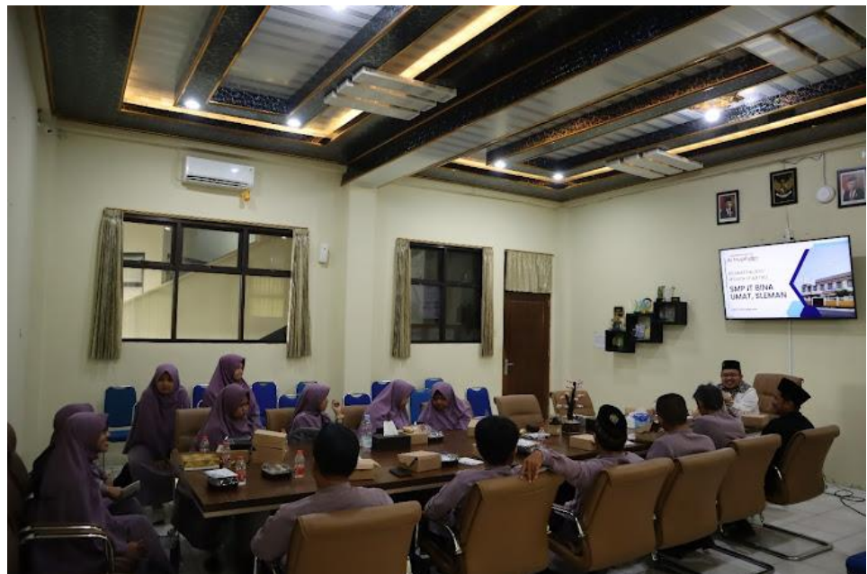
Gambar 2 Suasana Rapat Guru di Ruang Rapat