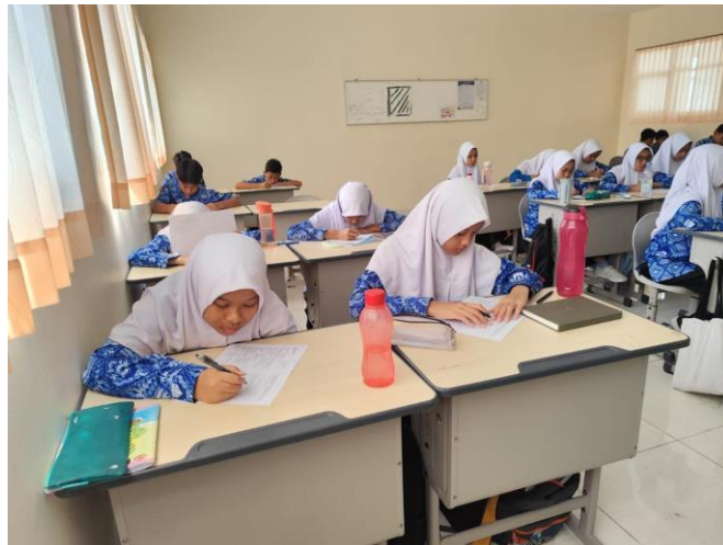
Gambar 9. Suasana Pembelajaran

dapat guru pantau melalui penugasan proyek atau diistilahkan Buku Muhasabah Diri yang akan menjadi alat ukur sejauh mana peserta didik telah menerapkan pembiasaan ala rasulullah tersebut baik di lingkungan sekolah maupun di rumah. 58