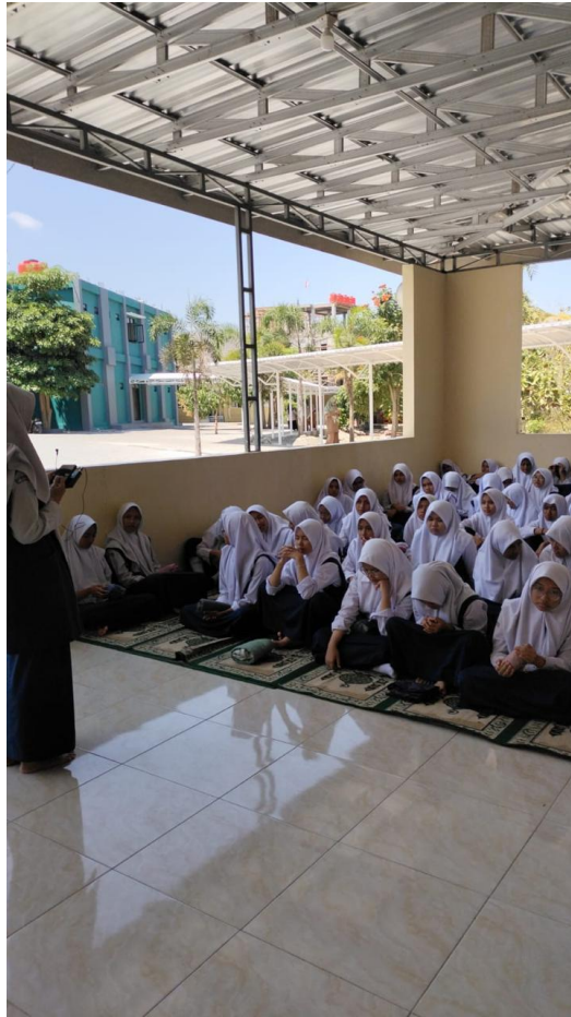
Gambar 6. Kultum, Suatu Implementasi Sifat Tabligh