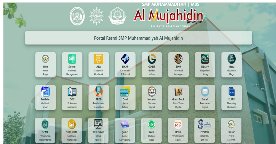
Gambar 1 Layanan Digital SMP Muhammadiyah Al Mujahidin

10,30 % dan bidang seni 32 prestasi atau 7,47 %. SMP Muhammadiyah Al Mujahidin Gunungkidul juga dilengkapi dengan fasilitas yang mewah dengan biaya pendidikan sangat terjangkau.