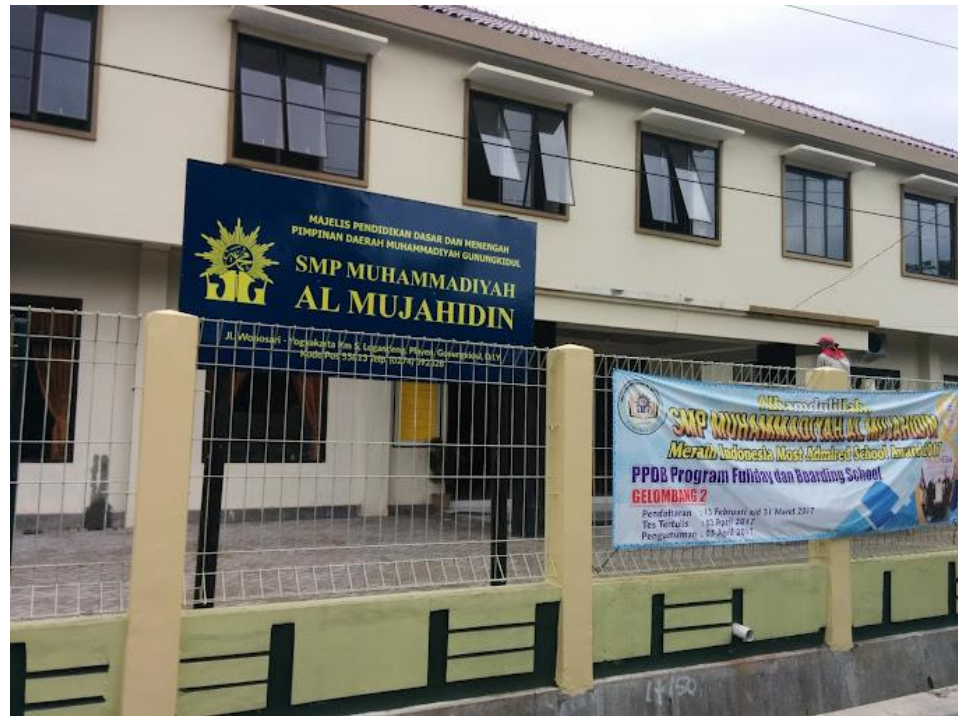
Gambar 3 Gedung Kampus 1