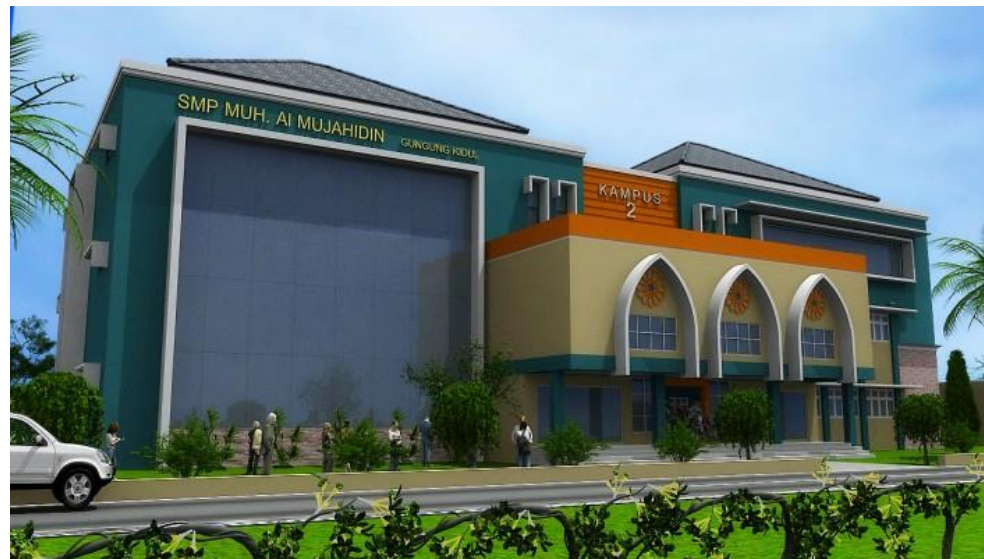
Gambar 4 Gedung Kampus 2