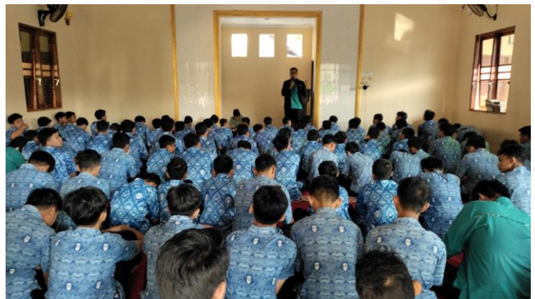
Gambar 8 Suaana Kultum Bakda Dhuhur