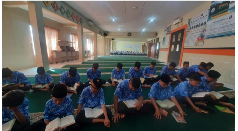
Gambar 7. Suasana Tahsin