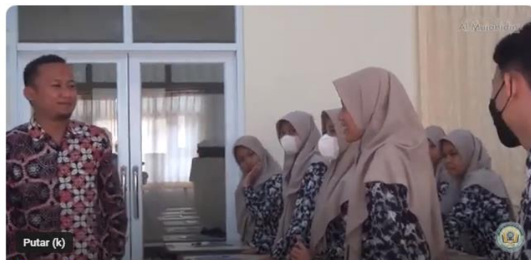
Gambar 5. Suasana Pembelajaran PAI yang menyenangkan

Ketiga, Program Pembinaan Karir: Program ini membantu siswa dalam merencanakan karir dan merancang langkah-langkah untuk mencapai tujuan karir mereka sehingga dapat meningkatkan motivasi belajar dan kesiapan mereka untuk masa depan.