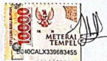
Safira Nur Madinah

Yogyakarta, 13 September 2024 Yang menyatakan,