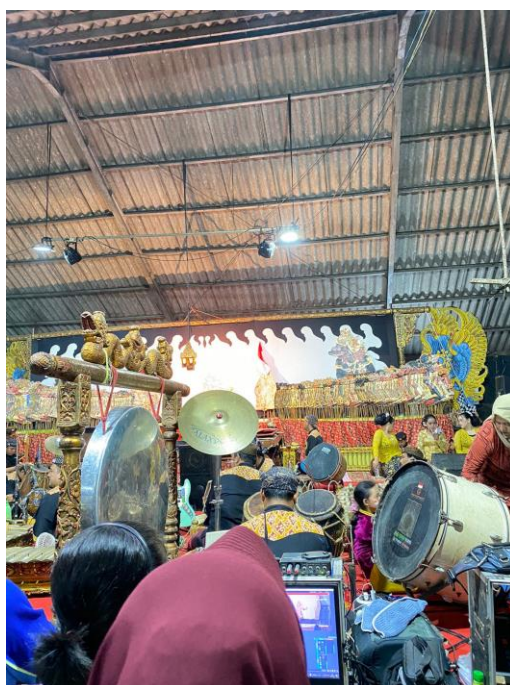
Hiburan Kesenian Wayang