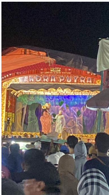
Hiburan Kesenian Sandiwara