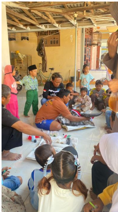
Menghias Kepala Kerbau