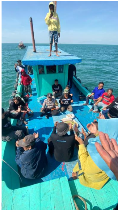
Berdoa di tengah laut