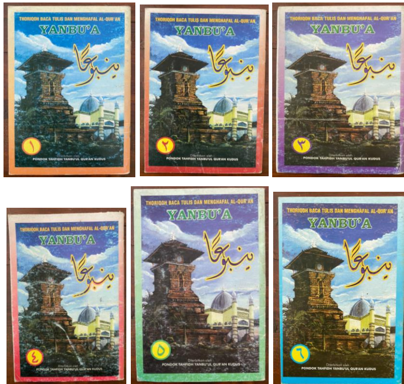
Gambar 2 Jilid Yanbu'a 1-6