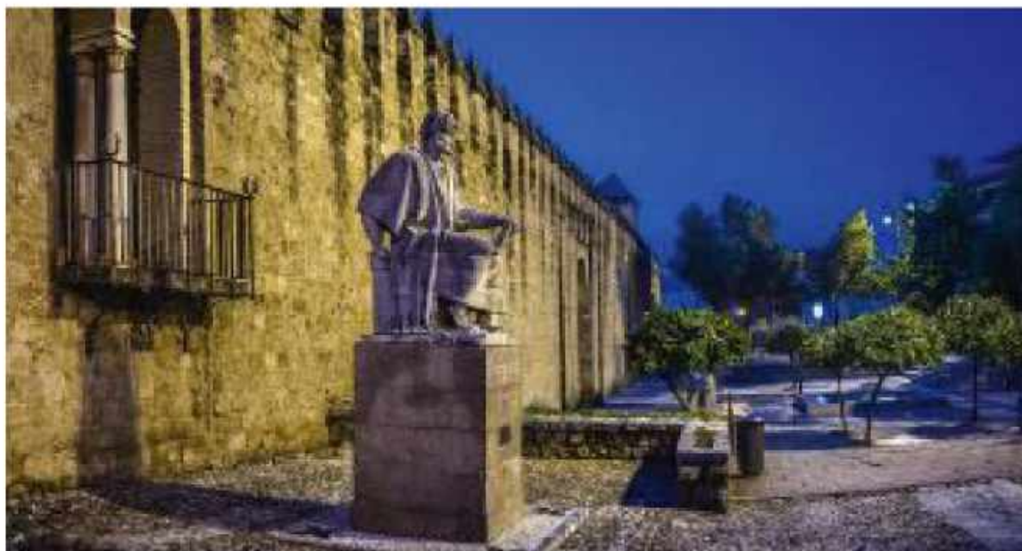
Gambar 4.1 Patung Ibnu Rusyd di Cordoba, Spanyol 16