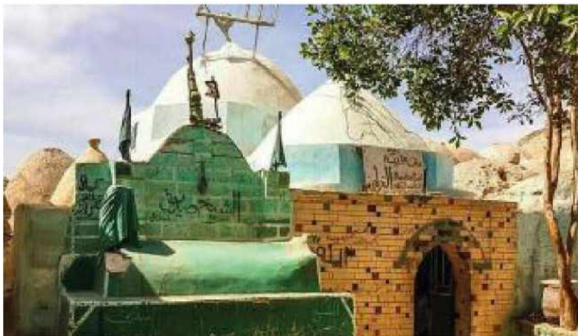
Gambar 4.2 Makam Imam Qurthubi di Maniya Mesir 22

penafsiran alqur'an dengan qur'an dan juga alqur'an dengan hadis, bahkan juga penambahan penjelasan tafsir dengan syair arab dan makna kalimat asing dalam bahasa arab lalu menganalisa pendapat para ulama dan memberi kesimpulan dari pendapat tersebut yang dianggap kuat. Dan kitab ini termasuk kitab tafsir yang besar yang terdiri dari 24 jilid. 21