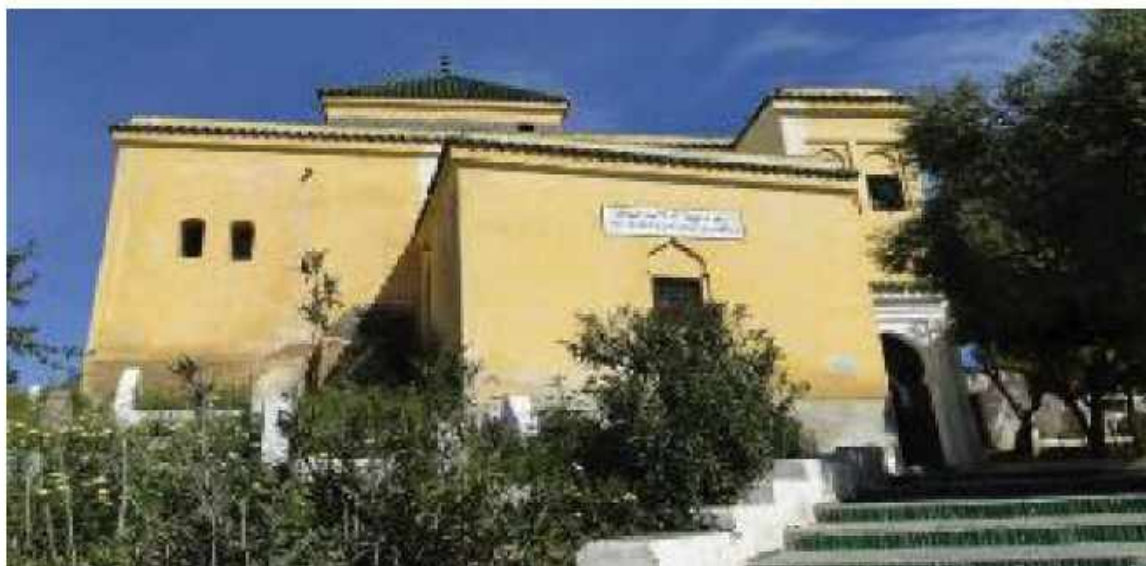
Gambar 4.3 Makam Qadli Abu Bakar Ibnu al-'Arabi di Fes, Maroko 28

Dari sini sangat jelas jika Ibnu al-'Arabi merupakan ulama besar dengan keilmuan yang sangat luas dalam berbagai bidang seperti hadis, fikih, ushul, ulum al-Qur'an, adab, nahwu, Tarikh. Tidak hanya itu, Ibnu al-'Arabi merupakan salah satu ulama yang diberi kelebihan ilmu dan harta. Menurut Abu Qasim bin Basykuwal seperti dikutip Dzahabi dalam Siyar A'lam al-Nubala , jika Ibnu al-'Arabi di akhir hayatnya meninggalkan Andalusia dan menetap di kota Fez, Maroko, hingga meninggalnya disana pada bulan Rabiul Akhir tahun 543 H. tahun yang sama dengan wafatnya al-Musnid al-Kabir Abu al-Dur Yaqut al-Rumi al-Saffar. 27