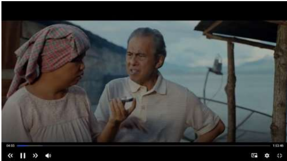
Gambar 3.8 Scene Bapak tidak Menyetujui Pasangan Domu