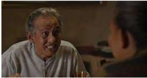
Gambar 2.2 Tokoh Pak Domu

Karakter penting sekaligus menjadi peran utama dalam film ‘Ngeri-Ngeri Sedap’ ini disebut sebagai Pak Domu yang diperankan oleh aktor senior Indonesia Arswendy Beningswara Nasution. Berperan sebagai Bapak dan kepala keluarga yang keras kepala dan kolot berhasil membuat semua penonton emosi dengan karakternya. Menjadi seorang Bapak yang selalu memaksa kehendak dan pandangannya ke semua anggota keluarganya. Tanpa disadari Pak Domu adalah peran Bapak yang tidak pernah mengajari anak-anaknya untuk saling menyayangi, terutama kepada ketiga putranya. Pak Domu selalu memperlihatkan sikap yang ketus dan kaku pada ketiga putranya tersebut.