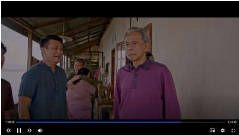
Gambar 3.16 Scene Bapak Meninggalkan keluarganya