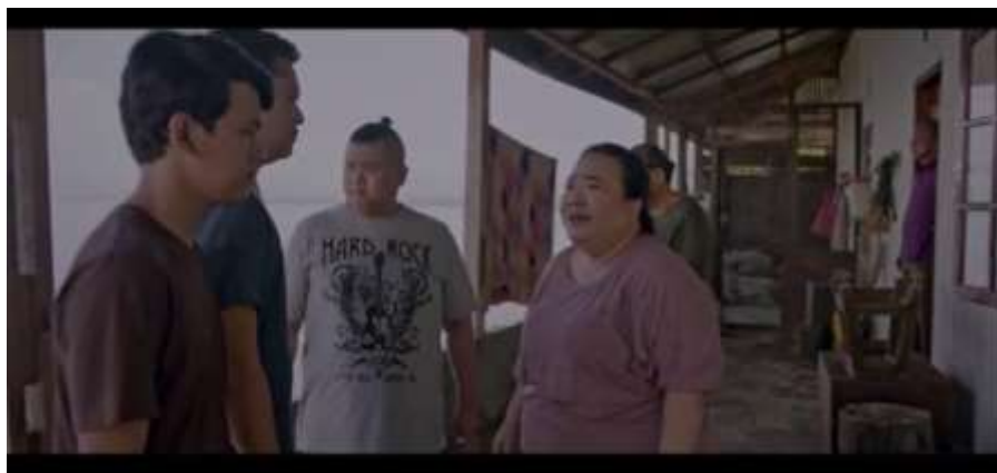
Gambar 3.12 Scene Bapak Menentukan Pilihan Hidup Sarma