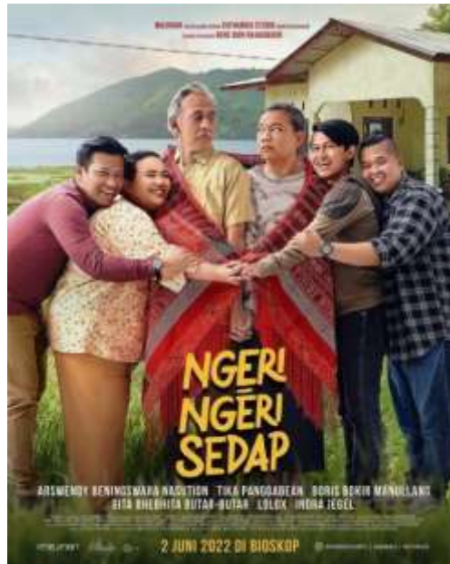
Gambar 2.1 Cover Film Ngeri-Ngeri Sedap

Film Ngeri-Ngeri Sedap merupakan film bergenre drama comedy yang rilis pada 2 Juni 2022 lalu. Film ini diproduksi rumah produksi Imaginary yang disutradarai oleh Bene Dion Rajagukguk dan dibintangi oleh aktor-aktor ternama Indonesia seperti Tika Panggabean, Arswendi Bening Swara, Gita Bhebhita Butar-Butar, Lolox, Boris Bokir Manullang, Indra Permatasari dan Indra Jegel.