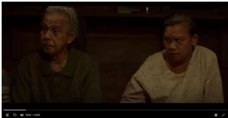
Gambar 3.7 Scene Bapak Berbicara akan Menutupi Kekurangan Uang Adat

Pada scene ini memperlihatkan adegan saat Pak Domu dan Mak Domu sedang berdiskusi dengan keluarga Pak Domu untuk membahas acara adat yang akan dilaksanakan oleh keluarga Pak Domu. Dalam scene tersebut Pak Domu mengambil keputusan akan menutupi kekurangan uang untuk acara adat namun tanpa didiskusikan terlebih dahulu dengan istrinya yaitu Mak Domu.