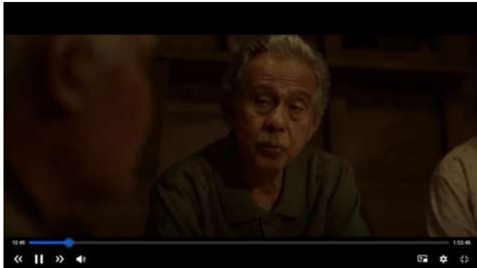
Gambar 3.6 Scene Bapak Berbicara akan Menutupi Kekurangan Uang Adat