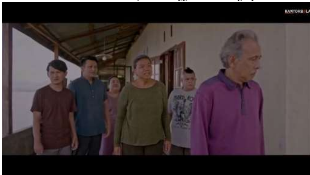
Gambar 3.17 Scene Bapak Meninggalkan keluarganya

Adegan dalam scene di menit 1.29.26 menampilkan Pak Domu yang meninggalkan keluarganya begitu saja saat semua anggota keluarganya ingin menyelesaikan masalah. Bapak meninggalkan keluarganya disaat permasalahan keluarga mereka semakin rumit, dia pergi dengan alasan pusing dengan situasi tersebut dan mengatakan akan menyelesaikan masalahnya nanti. Melihat Bapak hendak pergi, anak-anak serta istrinya berusaha menahan dan mengajak Bapak untuk segera menyelesaikan masalah mereka. Alih-alih mendengarkan perkataan mereka, Bapak tetap pergi dan tidak memperdulikan perkataan keluarganya.