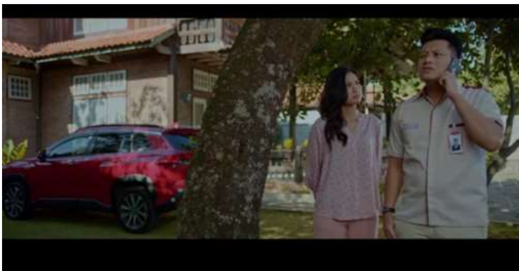
Gambar 3.9 Scene Bapak tidak Menyetujui Pasangan Domu

Pada scene ini terlihat bagaimana konflik anak pertama yaitu Domu dengan Bapak. Domu yang merupakan penerus marga dalam keluarga memilih pasangan berdarah Sunda, hal tersebut sangat ditentang oleh Pak Domu karena pilihan domu tersebut tidak sesuai dengan keinginannya dan juga tidak sesuai dengan adatnya. Alih-alih mengikuti keinginan sang Bapak, Domu memilih tidak menghiraukan restu dari orang tuanya tersebut. terlihat bagaimana Pak Domu yang sangat tidak suka dengan pilihan anak pertamanya tersebut. Pemikiran Pak Domu yang kolot sangat bertolak belakang dengan pemikiran Domu yang menganggap jaman sudah maju.