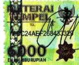
Agung Kurnia Prakoso (12511465)