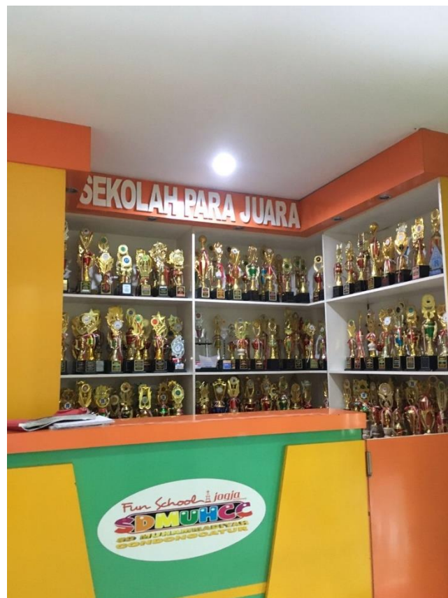
Dokumentasi prestasi SD Muhammadiyah Condongcatur