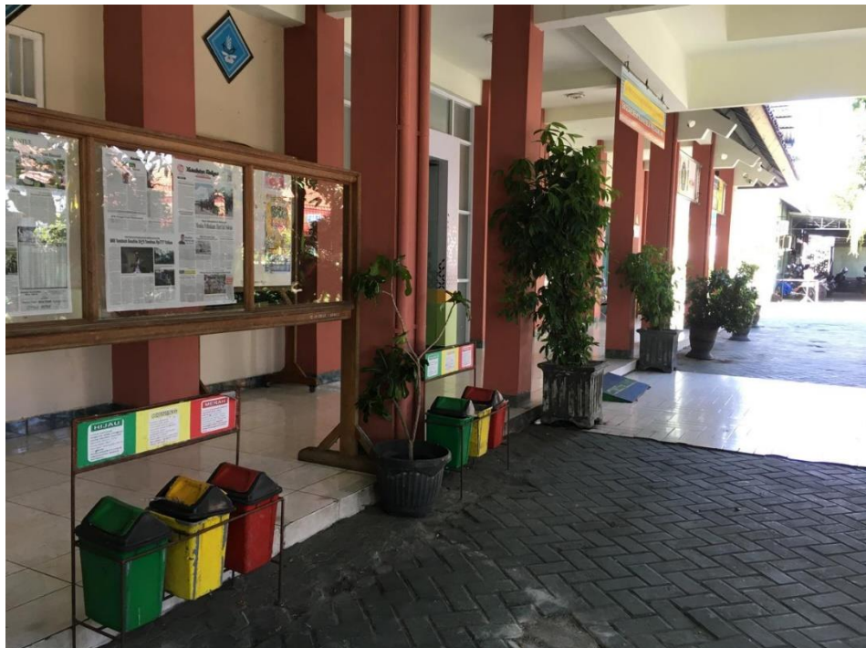
Dokumentasi halaman sekolah