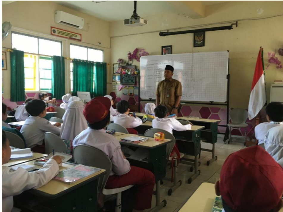
Dokumentasi proses pembelajaran