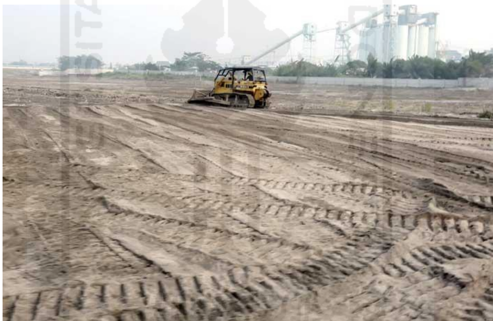
Gambar 1.2 Kondisi Eksisting Terminal Multi Purpose Kuala Tanjung, Medan.