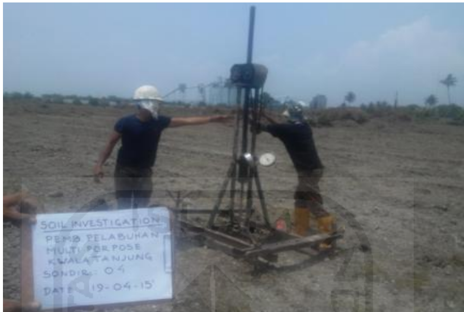
Gambar 1.3 Penyelidikan Tanah pada Terminal Muti Purpose Kaula Tanjung