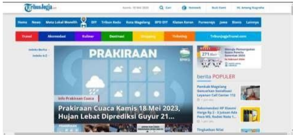
Gambar 1 Tampilan Interface Portal Tribun Jogja

Visi dari Tribun Jogja adalah menjadi kelompok usaha penerbitan surat kabar, media online , dan percetakan daerah yang terbesar dan tersebar di wilayah DIY dan Jateng. Sedangkan misi yang dimiliki oleh Tribun Jogja adalah, menciptakan informasi yang terpercaya untuk memberikan spirit baru dan mendorong terciptanya demokratisasi di daerah dengan menjalankan bisnis yang beretika, efisien, dan menguntungkan.