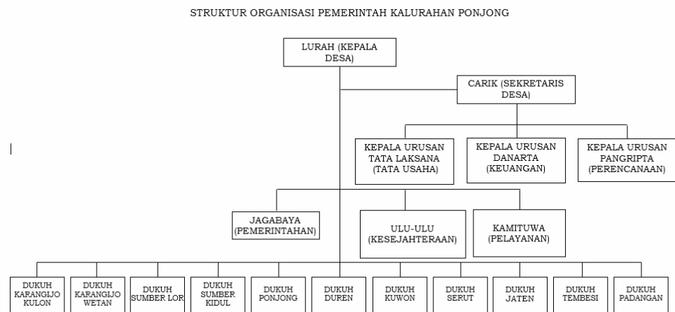
Gambar 4.1 Struktur Pemerintahan Desa Ponjong