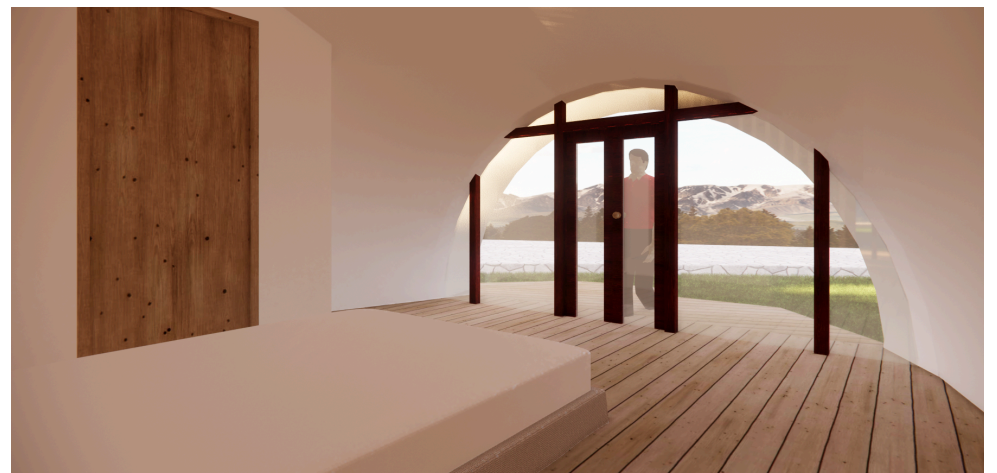
Gambar 67. Gambar Render Perspektif Interior Sumber : Dokumentasi Penulis,2023