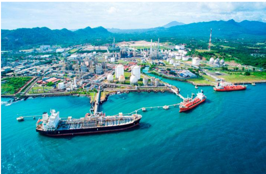
Gambar 2. 7 Jetty