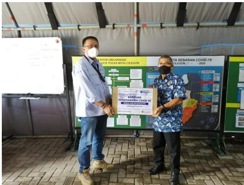
Gambar 3. 2 Simbolis Pembagian Sembako pada Masyarakat

Program CSR pemberian sembako yang dilakukan oleh PT. Chandra Asri Petrochemical pada tahun 2020 di daerah Serang, Banten. Program ini ditujukan kepada masyarakat yang membutuhkan. Melalui program ini perusahaan memberikan berbagai macam bentuk bantuan sembako yang berisi bahan makanan pokok dan kebutuhan sehari-hari yang dibutuhkan masyarakat.