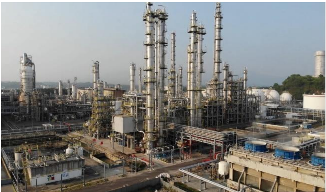
Gambar 2. 9 MTBE & B1 Plant