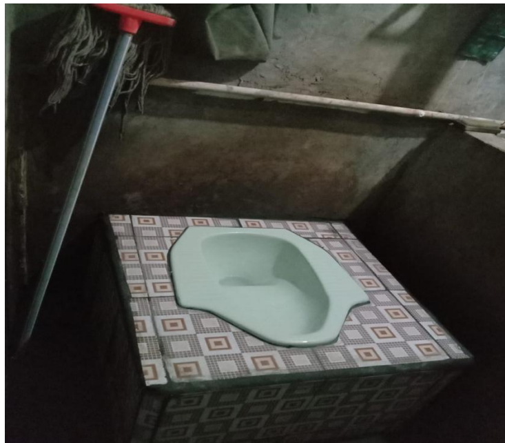
Gambar 3. 3 Hasil Pembangunan Jamban Ramah Lingkungan

“...agar limbah yang dikeluarkan tidak mencemari lingkungan sesuai dengan baku mutu air..” (Wawancara Bu Inge, 14 Maret 2023)