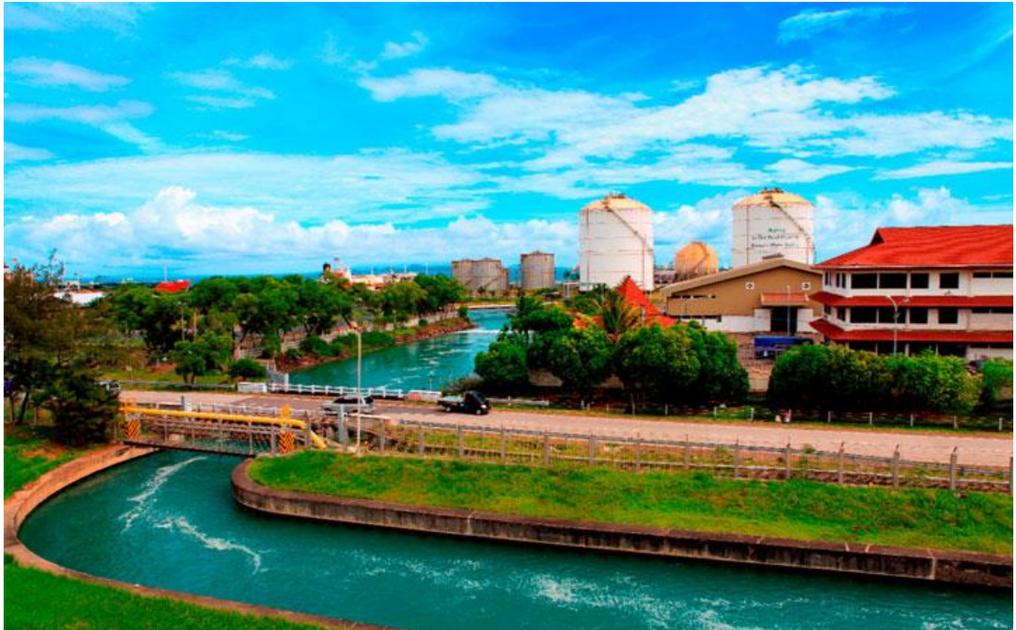
Gambar 2. 8 Supporting Facilities