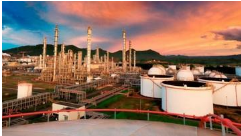
Gambar 2. 1 Pabrik PT Chandra Asri Petrochemical