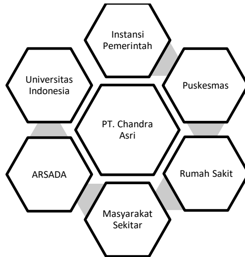
Gambar 3. 7 Jajaran Stakeholder CSR PT. Chandra Asri Petrochemical (PENTAHELIX)

Jajaran stakeholder pada perusahaan PT. Chandra Asri Petrochemical disebut sebagai PENTAHELIX.