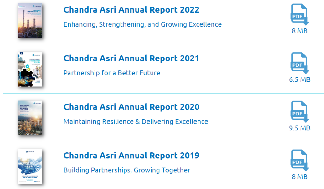
Gambar 3. 8 Annual Report PT. Chandra Asri