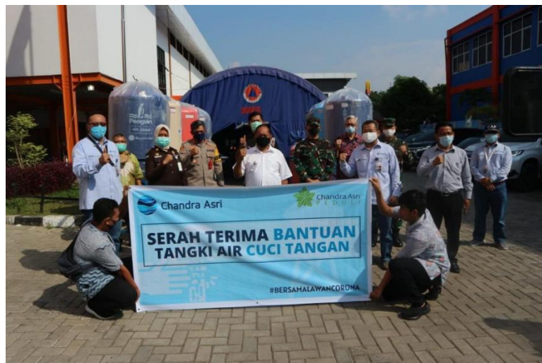
Gambar 3. 6 Penyerahan Bantuan Tangki Air Cuci Tangan

Dengan dasar alasan itulah, PT. Chandra Asri Petrochemical melakukan kegiatan CSR ini pada masyarakat sekitar. Melalui program ini perusahaan menyediakan penyuluhan, dan edukasi terkait bagaimana mengelola kebersihan diri dan lingkungan. Dimulai dari bagaimana mencuci tangan yang benar, pengelolaan sampah, dan menerapkan pola makan yang sehat serta menjaga diri dari penyebaran virus covid 19. Pada proses pelaksanaannya PHBS dilakukan bersama dengan pemberian alat kesehatan dan alat kebersihan.