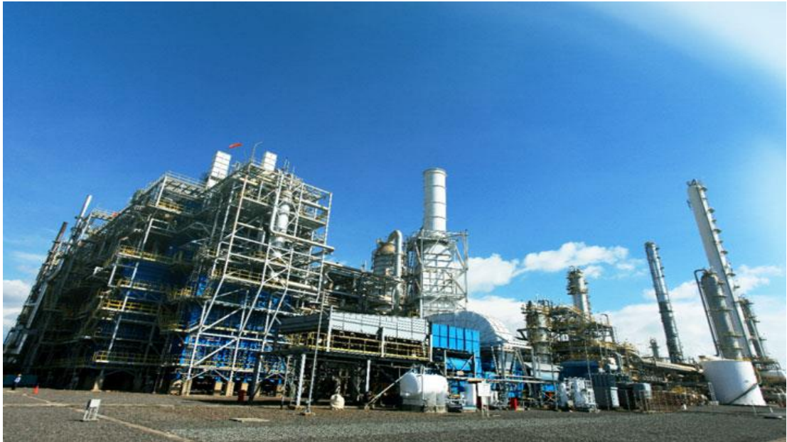
Gambar 2. 2 Olefins Plant