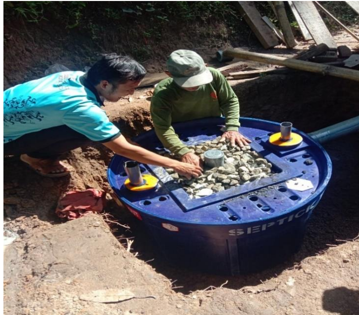
Gambar 3. 4 Pembangunan Jamban Ramah Lingkungan