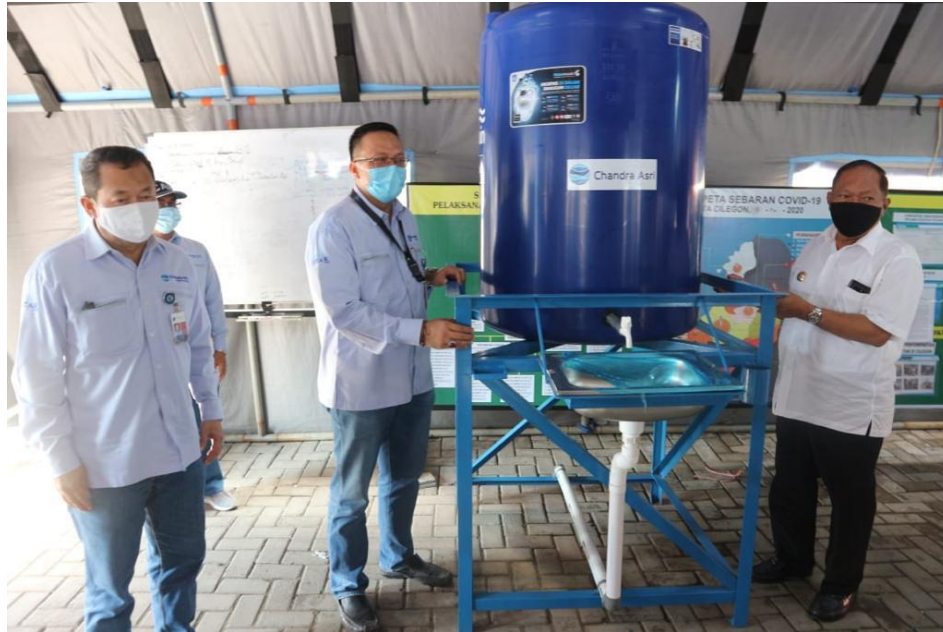
Gambar 3. 5 Pemberian Sanitasi Air Bersih