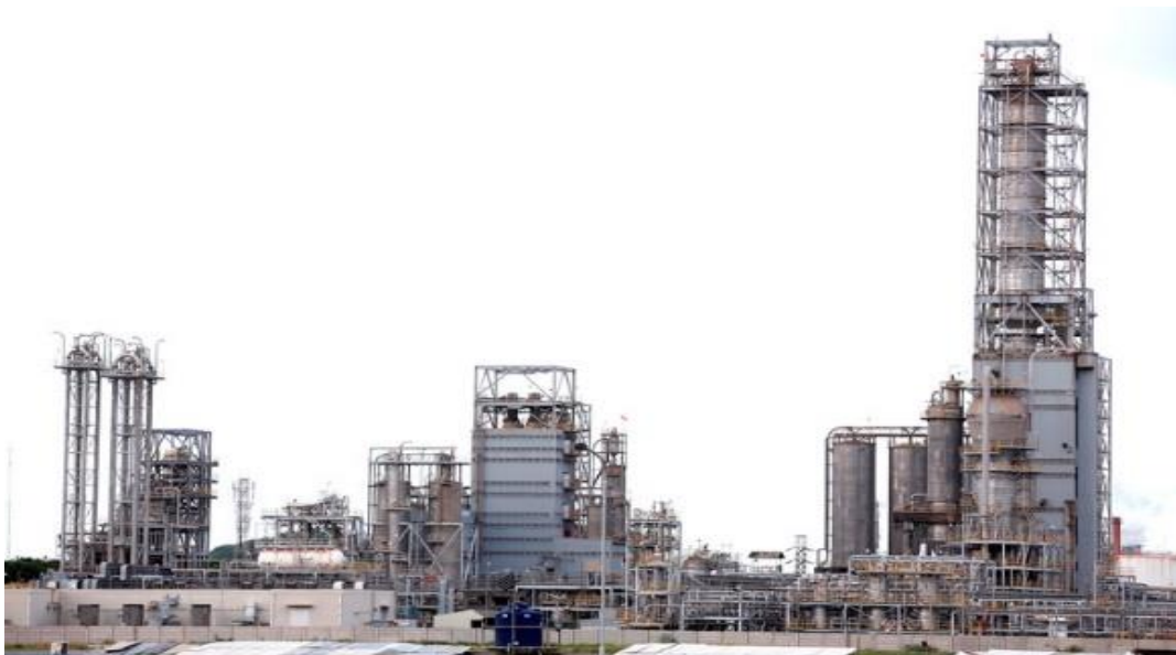
Gambar 2. 3 Polyethylene Plant