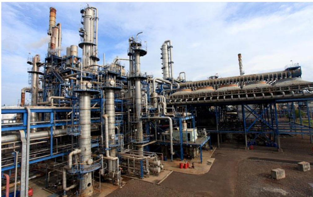
Gambar 2. 5 Styrene Monomer Plant