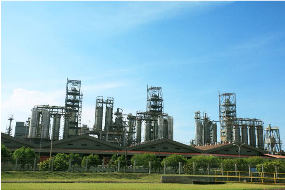
Gambar 2. 4 Polypropylene Plant