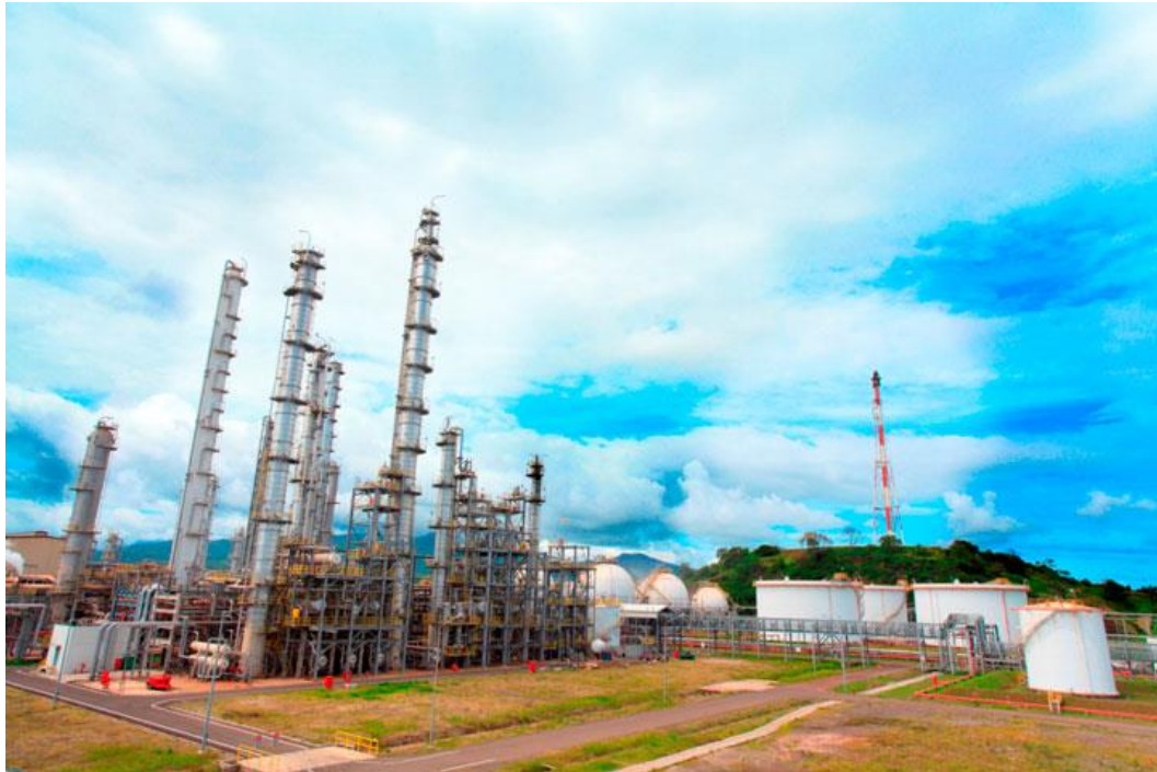
Gambar 2. 6 Butidiene Plant