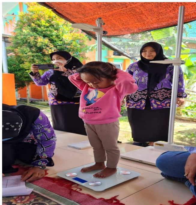
Gambar 3. 1 Monitoring Berat Badan pada Program POS Gizi

“POS gizi kita bekerja sama dengan puskesmas yang memang mereka punya aspek-aspek yang kita butuhkan..” (Wawancara Bu Inge, 14 Maret 2023)