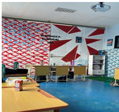
Gambar 1. Keadaan Kelas

Adapun Sarana dan prasarana di MTs Generasi Emas ini yaitu ada 1 ruang kepala madrasah yang digabung dengan ruang tata usaha, 2 ruang guru, 6 ruang kelas, 1 perpustakaan, 1 ruang ballroom, 12 kamar mandi, 1 ruang inklusi (untuk anak berkebutuhan khusus), 1 ruang UKS, 1 ruang laboratorium komputer, 1 laboratorium IPA, 1 ruang dapur, 1 ruangan dilantai satu biasanya digunakan untuk sholat berjamaah serta acara seperti acara madrasah orang tua dsb. Untuk mendukung kegiatan proses kegiatan belajar mengajar, sekolah harus memiliki sarana dan prasarana yang mendukung agar bisa berjalan dengan baik.