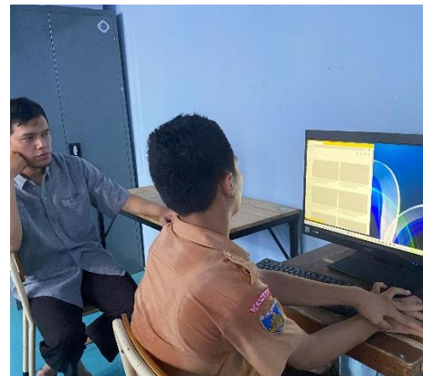
Gambar 5. Editing Video