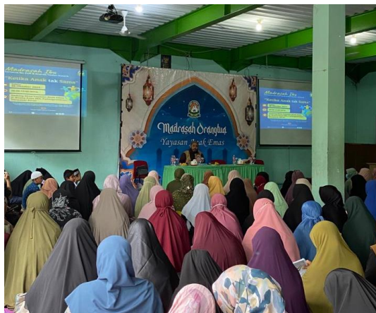
Gambar 6. Madrasah Orang Tua

Emas ini antara guru dan orang tua saling mendukung bekerja sama dalam mendidik anak mereka. Ketika sekolah memfasilitasi adanya kegiatan madrasah orang tua yang wajib untuk diikuti. Orang tua pasti datang ke sekolah untuk mengikuti acara tersebut bahkan bukan hanya itu, setiap tiga bulan sekali orang tua diberi tahu laporan perkembangan anaknya. Dari kegiatan ini dapat disimpulkan bahwa dukungan ini sudah berjalan dengan baik. 74