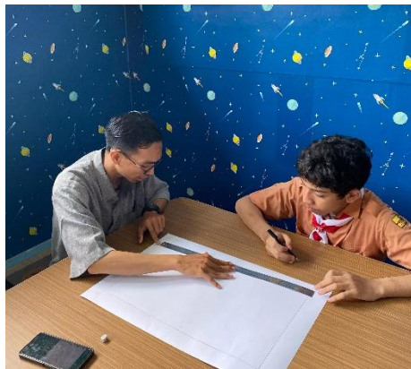
Gambar 4. Minat bakat menggambar

Peneliti tidak hanya observasi dan wawancara guru di MTs Generasi Emas Denpasar Bali, akan tetapi juga mengambil beberapa dokumentasi terkait peran guru sebagai pembimbing/mentor Berikut salah satu dokumentasi peran guru sebagai Pembimbing di kelas minat bakat: