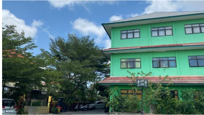
Gambar 3. Gedung Sekolah