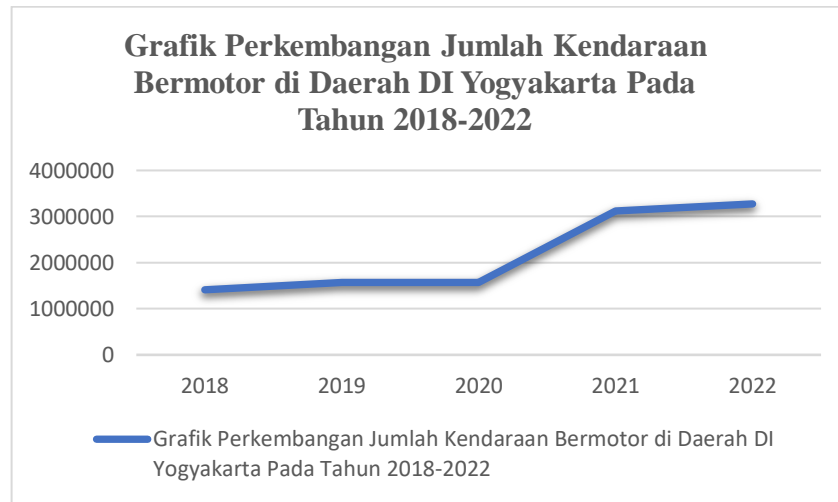
Gambar 2. 1 Perkembangan Jumlah Kendaraan Bermotor di DIY Pada Tahun 2018-2022

Sumber : Data Badan Pusat Statistik (bps.go.id, 2022)