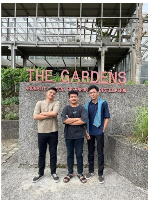
Gambar 4. 2 Riset Rumah Atsiri