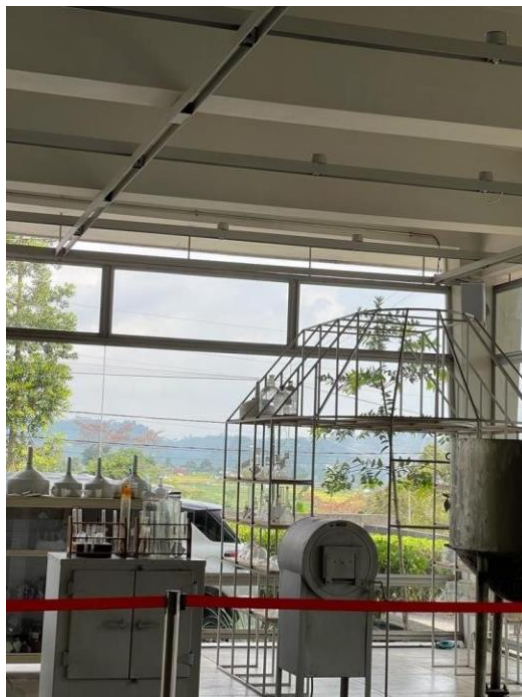
Gambar 4. 1 Riset Rumah