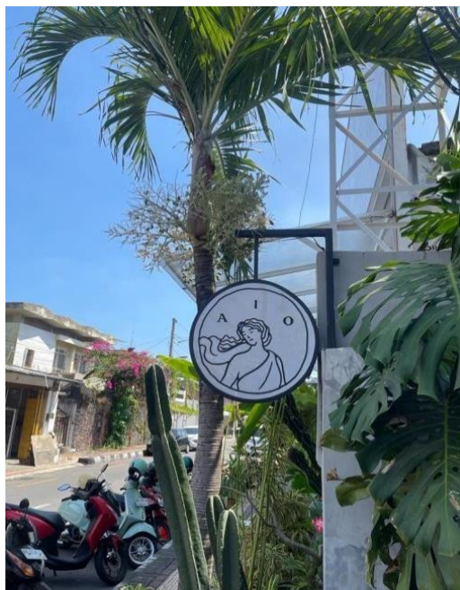
Gambar 4. 2 Riset AIO Yogyakarta