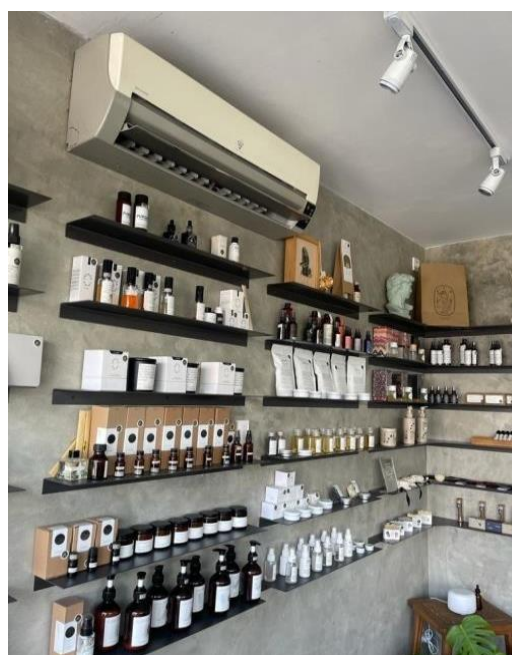
Gambar 4. 3 Riset Ke AIO Yogyakarta