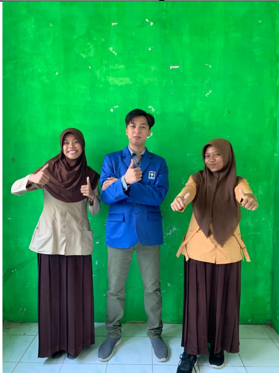
Setelah wawancara dengan siswi kelas XII