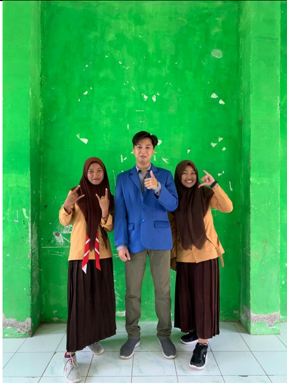
Setelah wawancara dengan siswi kelas XI