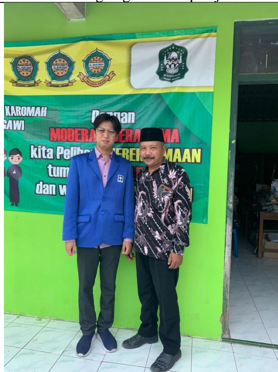
Setelah wawancara dengan kepala madrasah MA Al-karomah