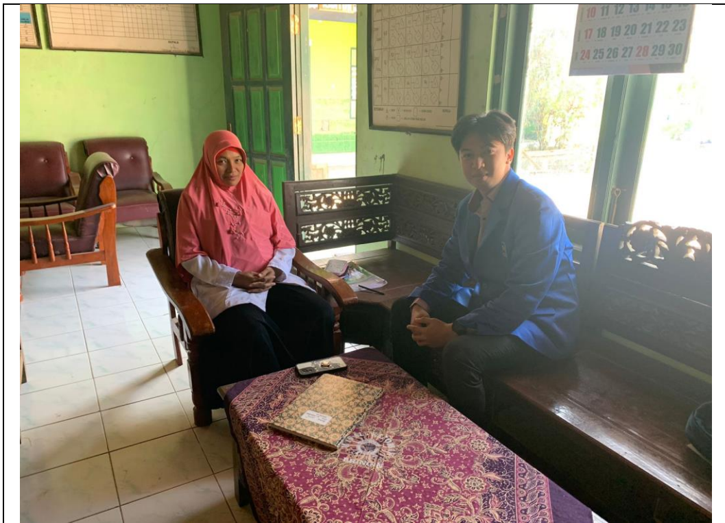
Setelah wawancara dengan guru mata pelajaran akidah akhlak