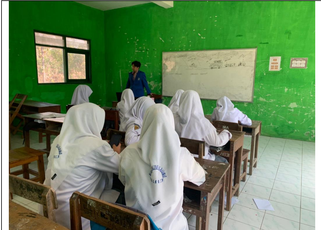
Observasi di MA Al-Karomah