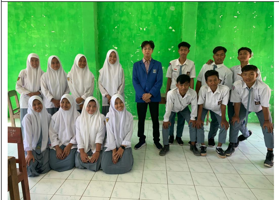
Setelah wawancara dengan beberapa siswa-siswi kelas X