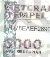
Yvan Fauzie Darajat