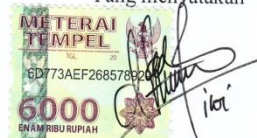
Dhona Windu Pratiwi