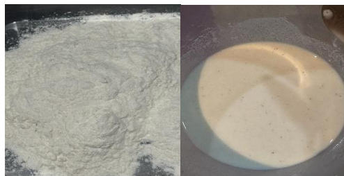
Gambar 3. 3 Tepung yang dipakai