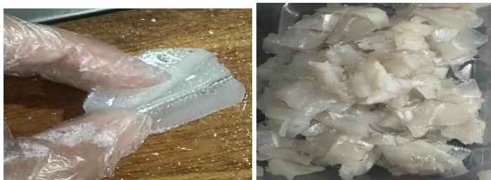
Gambar 3. 6 Proses membersihkan ikan

Bahan baku yang mentah selanjutnya akan dibersihkan dan kemudian diolah. Proses pengolahannya dilakukan dengan membalut tepung pada ikan dero dan setelah itu digoreng. Setelah matang, ditunggu dingin baru kemudian dikemas. Ikan dero crispy yang sudah matang dikemas menggunakan plastik pouch double sealed . Waktu operasional kegiatan produksi dilakukan dari hari Senin sampai Sabtu mulai pukul delapan pagi sampai jam satu siang.