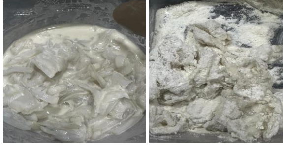
Gambar 3. 7 Proses membalut ikan dengan tepung