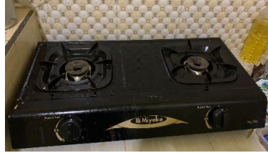
Gambar 3. 5 Peralatan yang diperlukan dalam proses produksi

Berikut adalah daftar alat dan bahan baku yang diperlukan dalam proses produksi :