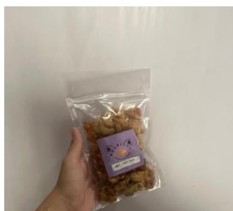
Gambar 3. 9 Produk yang dihasilkan