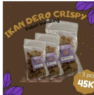
Gambar 4. 1 Promo paket bundling

bundling artinya konsumen sama dengan membeli tiga buah produk. Disaat yang sama hal itu juga akan meningkatkan penjualan terhadap produk.