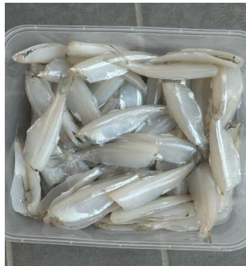
Gambar 3. 2 Ikan dero

transportasi, dan untuk tepung yang digunakan untuk membalut ikan deronya terkadang dibeli di pasar dan terkadang dibeli secara online di e-commerce ketika harganya lebih murah jika dibandingkan beli secara langsung. Pembelian tepung dilakukan secara langsung juga dilakukan ketika ada pesanan yang masuk dan tidak memungkinkan untuk membeli bahan baku secara daring.