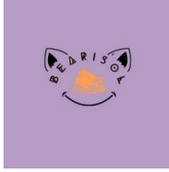
Gambar 3. 1 Logo usaha

Awal mula produk ikan dero crispy ini ditawarkan ke orang-orang sekitar seperti tetangga dan teman. Kemudian kami mencoba untuk menjualnya ke warung-warung sekitar dan toko oleh-oleh yang ada di Pati. Sampai sekarang pun masih menggunakan cara yang sama, akan tetapi jumlah pesanannya meningkat dibandingkan sebelumnya.