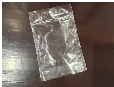
Gambar 3. 4 Plastik kemasan