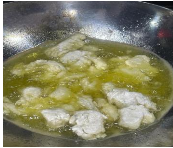
Gambar 3. 8 Proses penggorengan